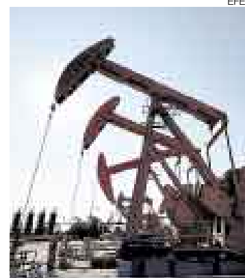
RESPIRO. El crudo bajó luego de llegar a los US$101,32 el barril.