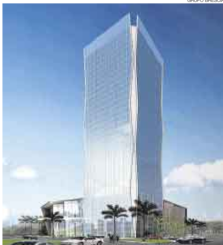
ASÍ SERÁ. El Westin Libertador Lima fue diseñado por la empresa Arquitectónica. El arquitecto a cargo es Bernardo Fort Brescia.

Cabe señalar que el hotel, dirigido principalmente al segmento corporativo y de negocios, tendrá un área construida de más de 72.000 m 2 , 311 habitaciones y cinco sótanos, cuatro de los cuales serán