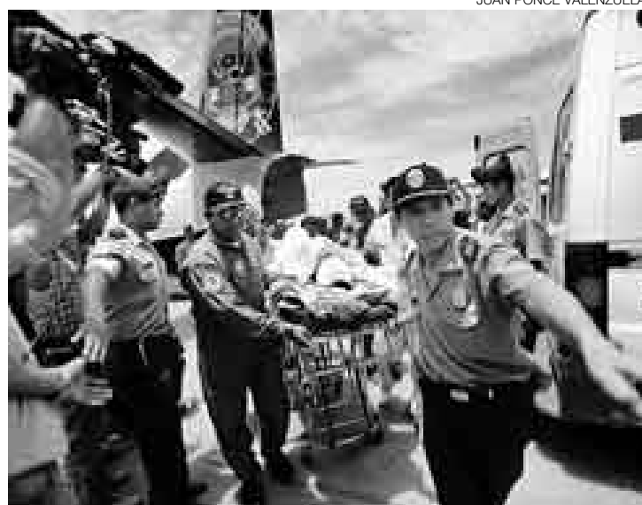
TRASLADO. Los policías heridos fueron traídos a Lima y recibidos por el ministro del Interior, Luis Alva Castro.