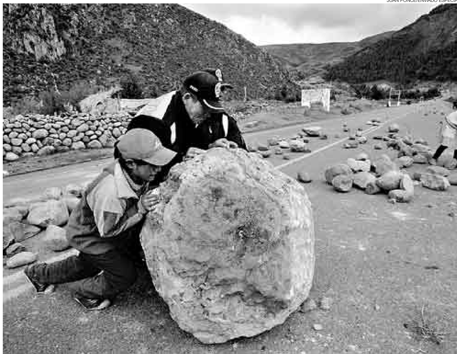
REORDENARSE. Luego de la agitación vivida en Ayacucho, los pobladores se dedicaron a devolver el orden en la ciudad.

De pronto llegó la orden de la suspensión del paro y de las marchas. A los manifestantes no les quedó otra cosa que retirarse silenciosamente. En ese momento un grupo de trabajadores co-