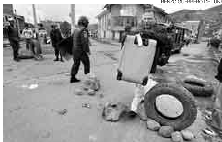
TENSIÓN. Los cusqueños atacaron locales e intentaron tomar el aeropuerto.

Ese fue el incidente más violento ayer en el inicio del paro de 48