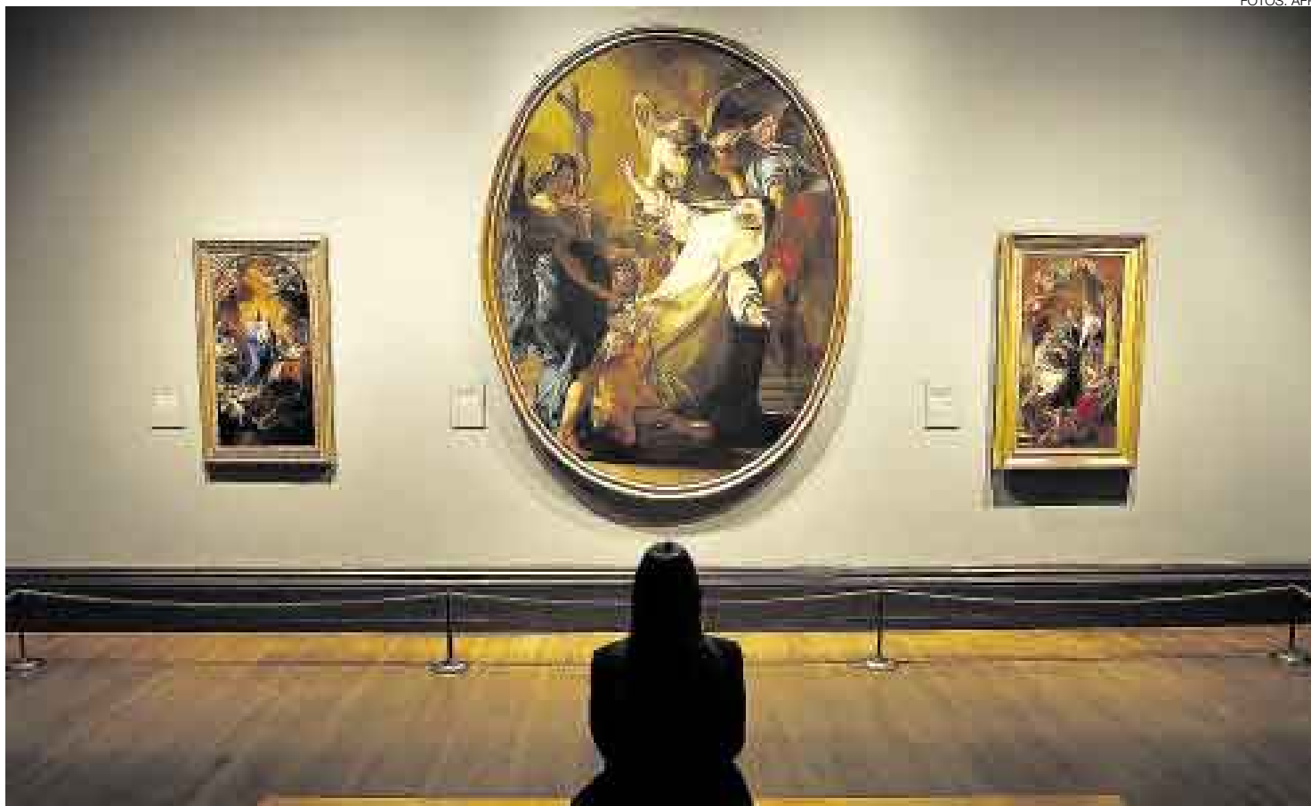
ADMIRACIÓN. Un visitante mira las obras "La gloria de la Virgen y niño", "El éxtasis de Catalina de Siena" y "La Virgen con el niño con San Juan Nepomuk".

Heredero de la tradición de los pintores renacentistas, Batoni nació en la localidad italiana de Lucca y pronto se trasladó a Roma para aprender las técnicas