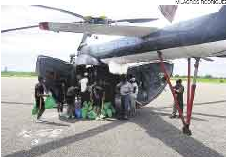
VÍVERES BÁSICOS. Los caseríos de Pocitos, Loma Saavedra e Isla Noblecilla (distrito de Aguas Verdes) fueron los primeros beneficiados.

permitirá el envío de unas cuatro toneladas de víveres para las 1.696 familias afectadas.