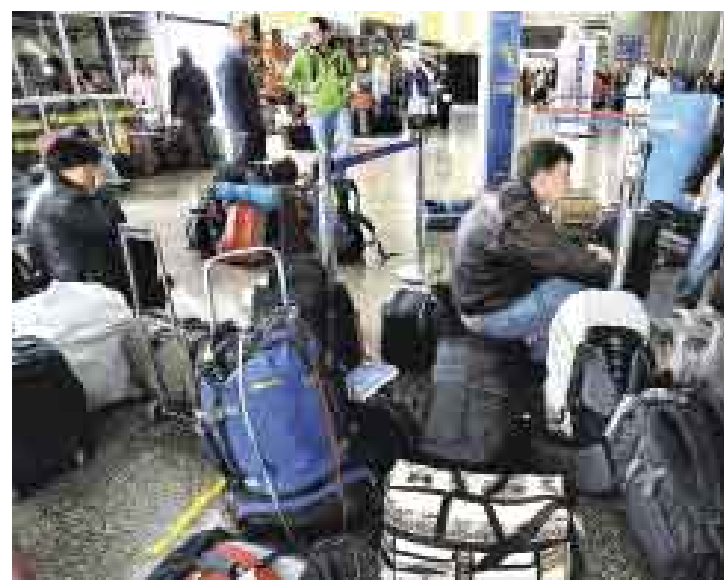
EN ESPERA. Los pasajeros del aeropuerto Velasco Astete tuvieron que aguardar un día más para salir de la Ciudad Imperial.