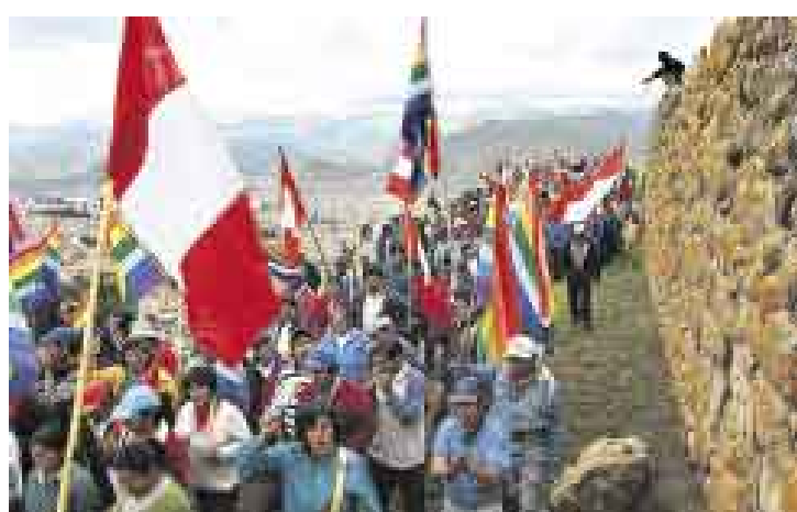
PACÍFICA. La protesta de un grupo de cusqueños en Sacsahuamán no ocasionó disturbios. Tras casi cuatro horas se retiraron.

Ellos, aproximadamente mil, llegaron portando pancartas y