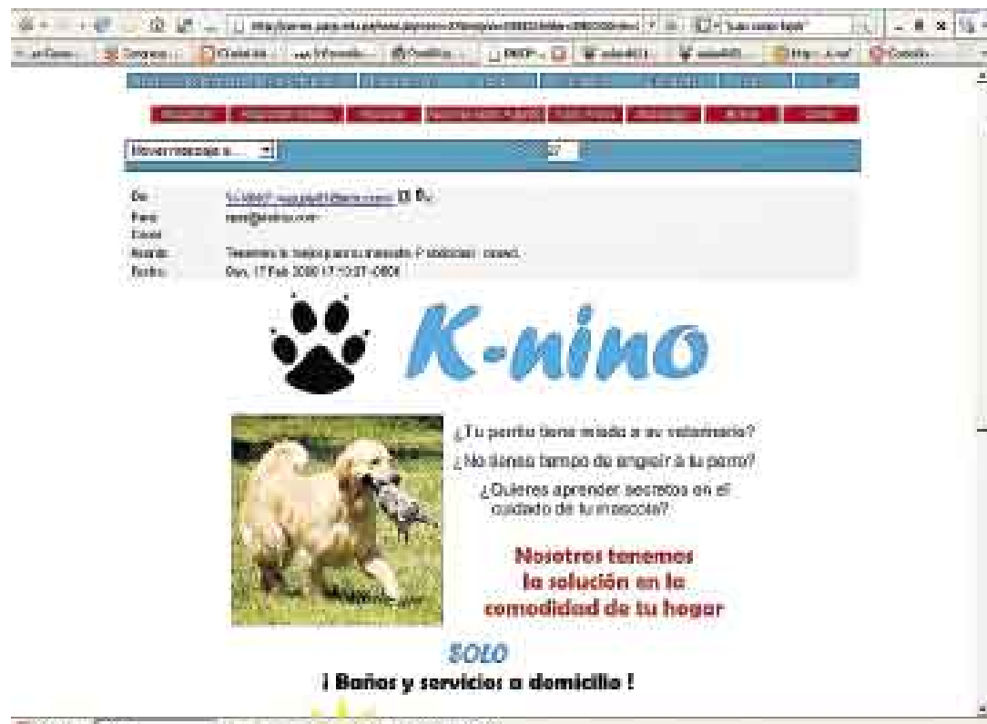
INVASIÓN A LA PRIVACIDAD. Captura de pantalla de un mensaje de correo no solicitado generado en Lima.

Añade que una vez terminado el proceso de queja, y si el denunciante no tuviera la razón, el Indecopi recién podrá cobrar la tasa impuesta por concepto de la denuncia, la cual no podrá supe-