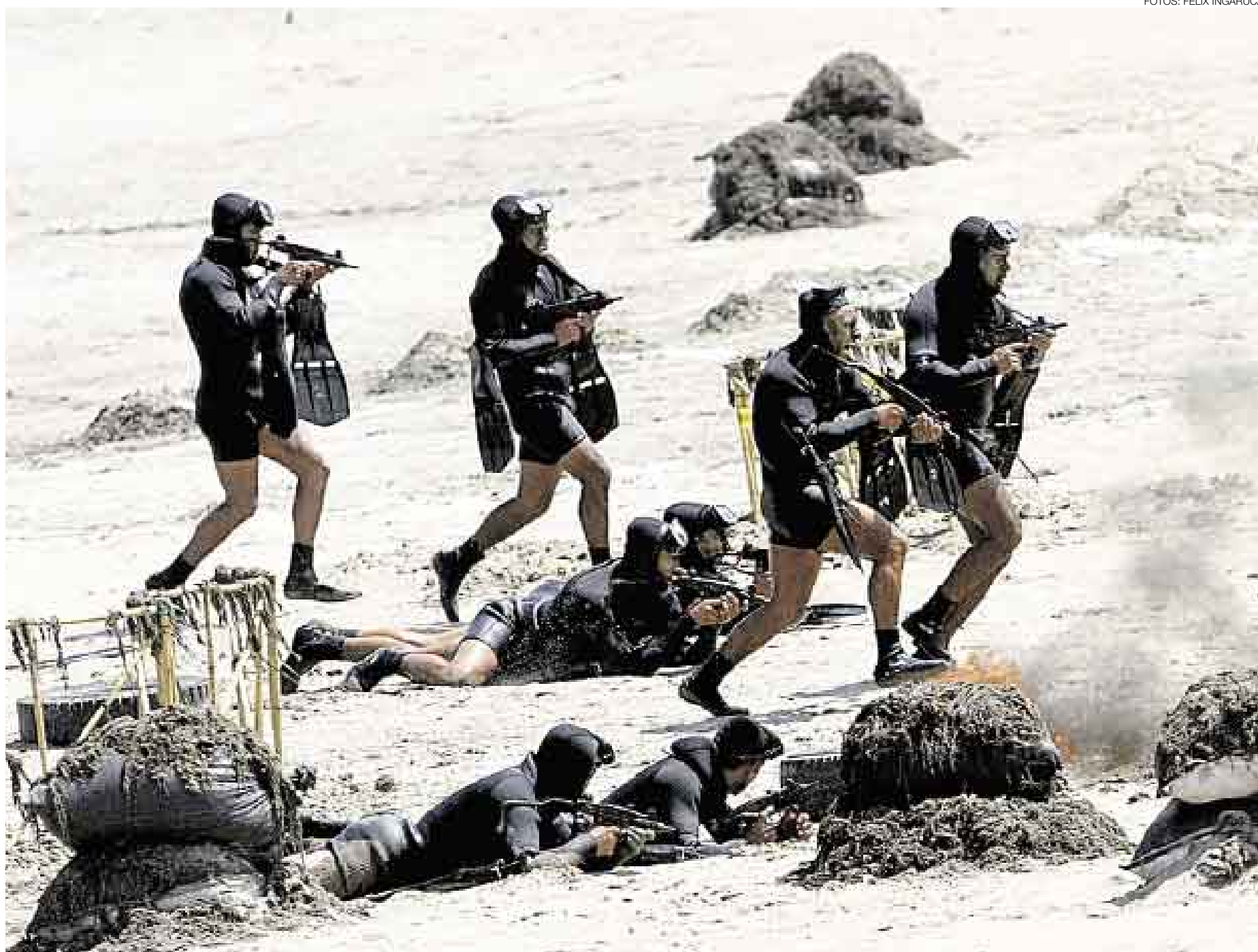
EN PLENA OPERACIÓN. Soldados demostraron su arrojo al realizar las exhibiciones militares tanto en la arena como en el mar. Esta escena muestra un simulacro de rescate de un rehén.

También hubo exhibiciones de diferentes regiones militares del país con armamento, comidas y danzas típicas del Perú. ■