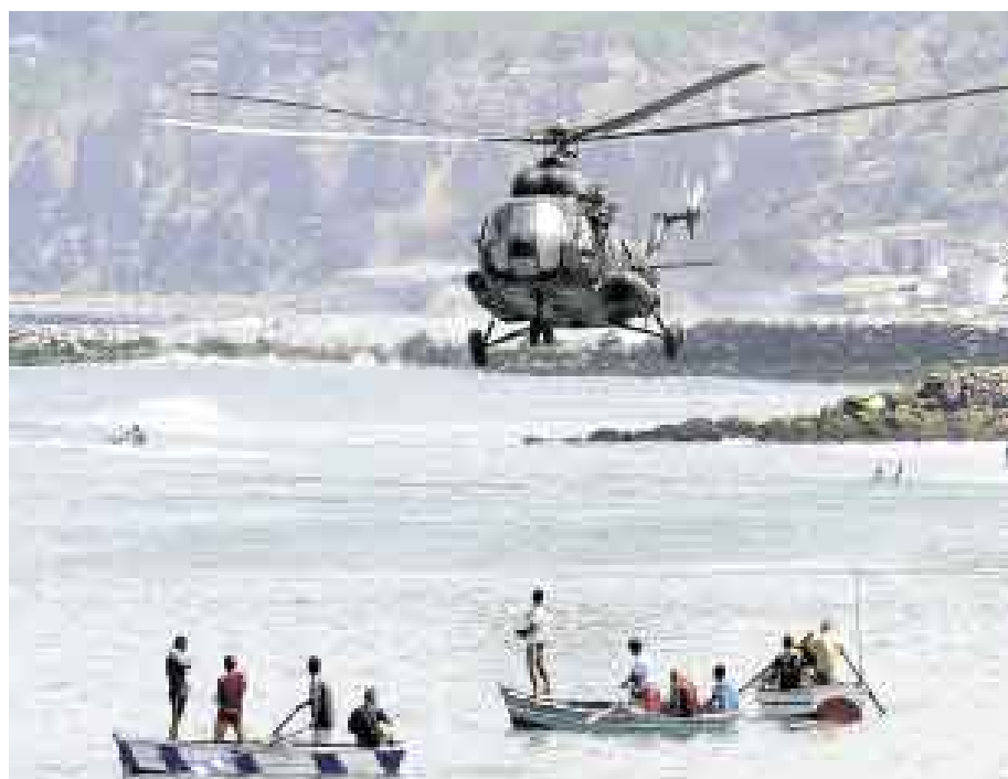
DESDE LO ALTO DEL CIELO. Un helicóptero del ejército circuló numerosas veces por la playa Agua Dulce mientras se desarrollaba la demostración de sus maniobras bélicas.