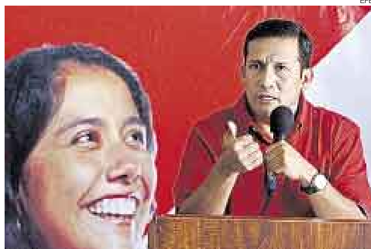
¿INSTIGÓ O SE APROVECHÓ? Las declaraciones del ex candidato presidencial Ollanta Humala podrían ponerlo en aprietos.

“Que comparezca en el proceso al lado de las personas detenidas o que están siendo procesadas. Esto constituye una decisión