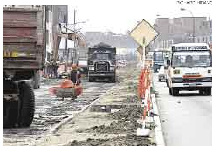
PASO RESTRINGIDO. Las labores se realizan en dos carriles de la pista.

Las obras se ejecutarán por partes. Los trabajos se han iniciado en los dos carriles que vienen desde el norte hacia el centro de Lima. La otra pista, que va hacia el norte, se ha convertido en vía de doble sentido. "No queremos perjudicar el paso de los carros que circulan por esta zona. Una vez que terminemos