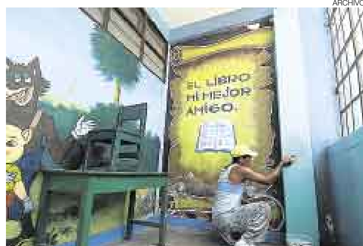
TRABAJOS. Colegios se preparan para el inicio de las clases en la capital.

El funcionario del Ministerio de Educación explicó que las