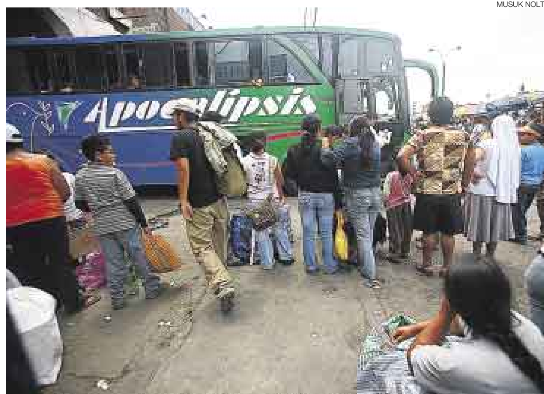
¿Y AHORA? En Yerbateros los pasajeros no tienen seguridad ni calidad de servicio. La informalidad campea.

En el 620 del jirón Montevideo las cosas no son del todo mejores. Una tienda acondicionada como salita de espera con 21 sillas y dos bancas es la puerta de ingreso a un garaje con capacidad para 6 ómnibus. Este local, sin embargo, es utilizado por