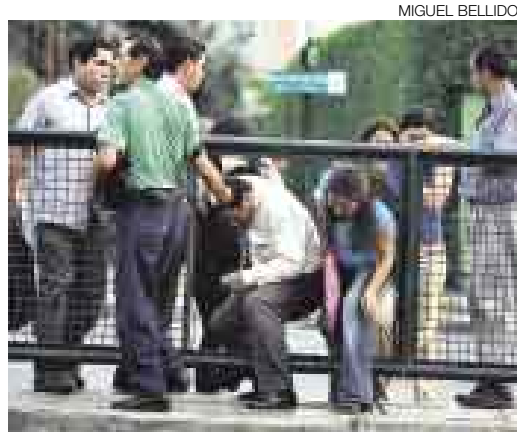
LA VIDA EN JUEGO. La reja de la berma central de la cuadra siete de Javier Prado Este antes y después. Algunos transeúntes siguen cruzando por el lado prohibido.

¿Santo remedio? Lamentablemente, no. Fue triste comprobar que hay quienes prefieren torear autos, saltar la reja, ensuciarse la ropa, sudar más de la cuenta, arriesgar el pellejo, dejar viudas o viudos y niños huérfanos, en vez de cruzar por una esquina. Caminar un poco, señores, no mata... Nuestro país va a cambiar si nosotros cambiamos. [A9]