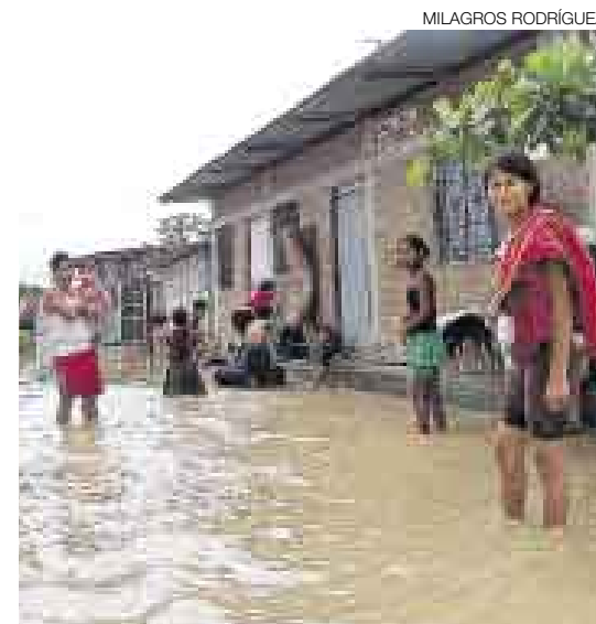
AGUAS VERDES. El asentamiento humano Tomás Arizola, en Tumbes, sufre los desbordamientos del río Zarumilla.

Lluvias e inundaciones golpearon al 25% de los ecuatorianos. [B12]