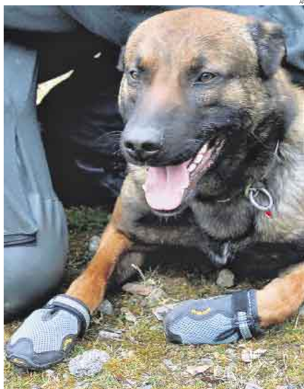
BUENA PINTA. Pastores alemanes y belgas son entrenados para caminar con estas zapatillas.

■ Más que una moda, se trata de una medida de seguridad en Dusseldorf. Los perros de la policía alemana calzarán zapatillas celestes cada vez que salgan a la calle en misión oficial, para evitar que se lastimen con restos de vidrios, botellas rotas o que se pinchen con las jeringas que dejan en los parques los drogodependientes. El calzado es de plástico, tiene suela reforzada y el juego de cuatro unidades cuesta unos 60 euros (US$90).