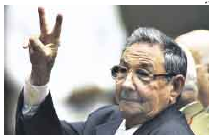
EL OTRO CASTRO. Raúl, nuevo líder elegido por los dirigentes del comunismo cubano, promete pequeñas libertades (ver: Después de Fidel).

Señores Directores: La revolución socialista en Cuba, que atrajo a muchos intelectuales y políticos de Latinoamérica, y con ella grandes ideales de justicia social, igualdad y fraternidad, ingresa a un nuevo período de su historia con la renuncia definitiva de Fidel Castro al poder. La falta de libertades políticas, atentados contra los derechos humanos y el poder de facto de Castro, sumados al bloque estadounidense de su economía y el fin del apoyo soviético por la caída del socialismo en Europa, hicieron de esta revolución algo incompleta y frustrante para el pueblo cubano. Ojalá se dé paso a reformas graduales para mejorar la calidad de vida de los cubanos y elecciones libres en la isla. La democracia y el Estado de derecho han demostrado ser el menos imperfecto de los sistemas de gobierno para alcanzar estos ideales.