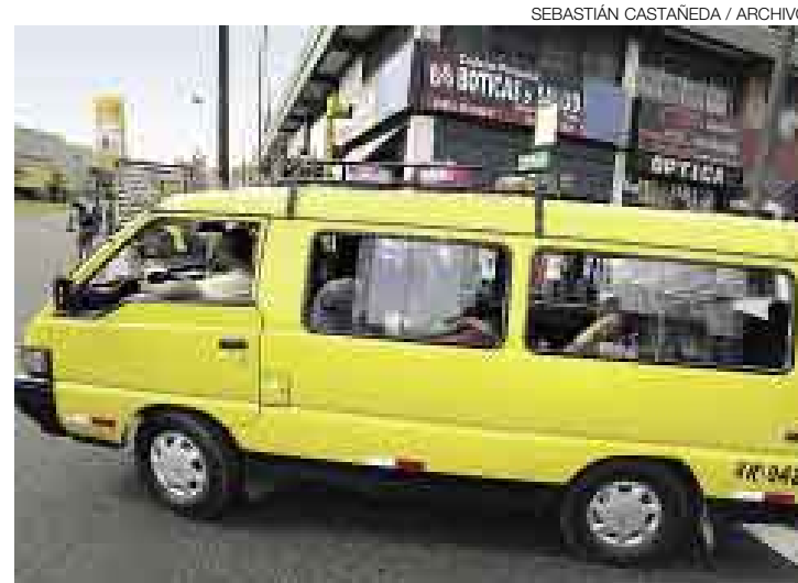
CUIDADO. Los padres de familia tienen también responsabilidad al elegir la movilidad escolar, la cual debe cumplir con todas las exigencias de seguridad.