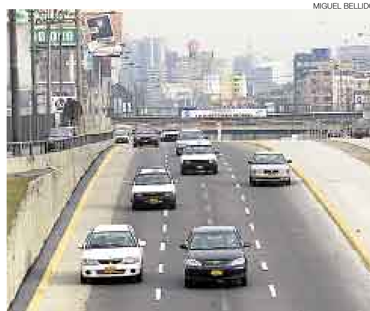
MIGUEL BELLIDO HORA PUNTA. Así lució la Vía Expresa a las 5:20 p.m. de ayer. Sin embargo, el tránsito estuvo congestionado desde el Paseo Colón hasta Alfonso Ugarte.

Además de ese cambio, también se observó en Alfonso Ugarte una disminución de los policías encargados de agilizar el tránsito a lo largo de ese corredor vial, en el Cercado de Lima. ■