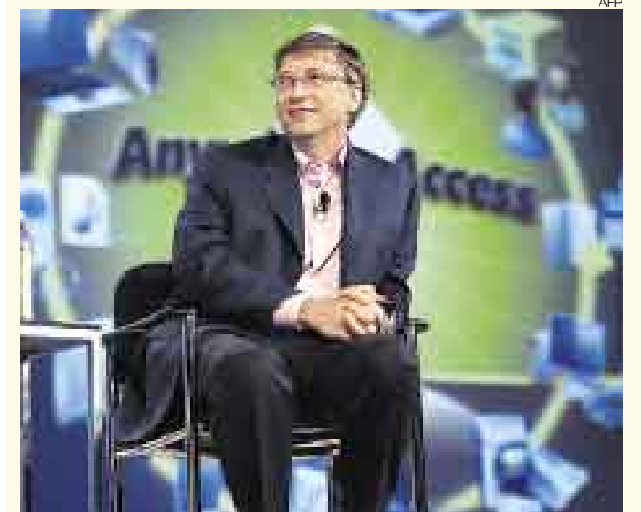
SANCIÓN. La multa a la empresa de Gates es por competencia desleal.