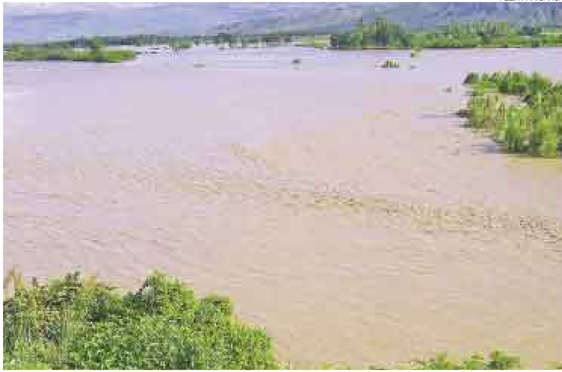
EN LA SELVA. El río Utcubamba, Amazonas, entre otros, han aumentado su caudal y se han desbordado.

El número de víctimas mortales por los aguaceros va en aumento