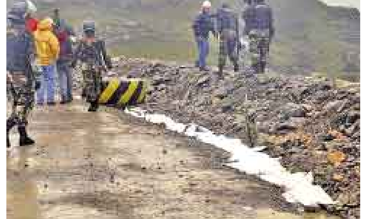
PARA INVESTIGAR. Minera Yanacocha señaló que este derrame es raro ya que por la zona no había pasado ningún vehículo con combustible.