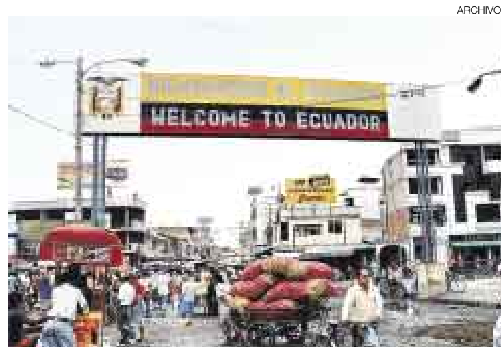
SERIOS CARGOS. Los detenidos en Aguas Verdes afrontarían acusaciones por convocar y aglutinar organizaciones subversivas.