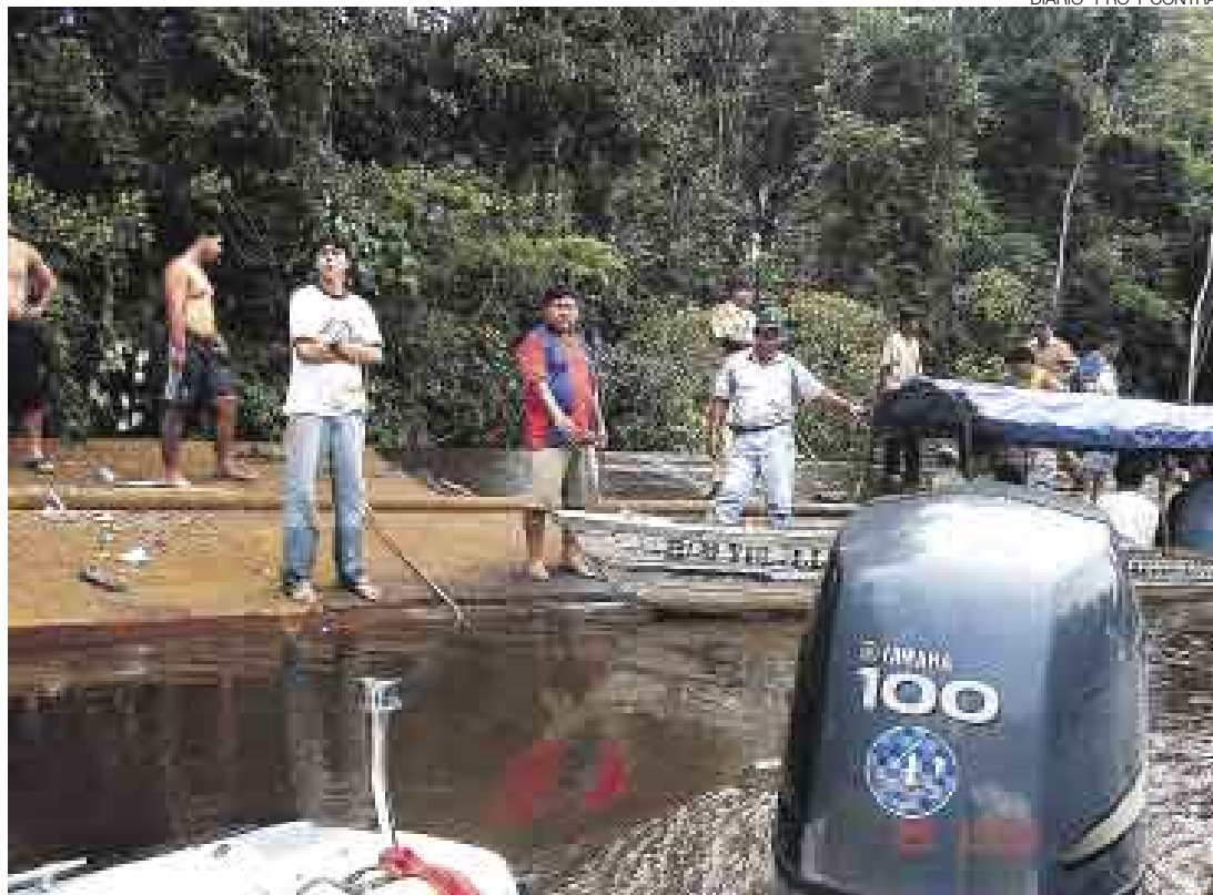
DE CABEZA. La embarcación quedó volteada, en medio del río Tapiche, por lo que algunos socorristas pudieron pararse sobre su casco. Por la noche se informó del rescate de cuatro sobrevivientes.

El jefe médico del centro de salud de Requena declaró a RPP que tres sobrevivientes son atendidos en ese lugar, entre ellos un niño de 11 años, con diagnóstico de shock postraumático, y cuya familia se encuentra desaparecida. Otros tres sobrevivientes fueron llevados a Iquitos.