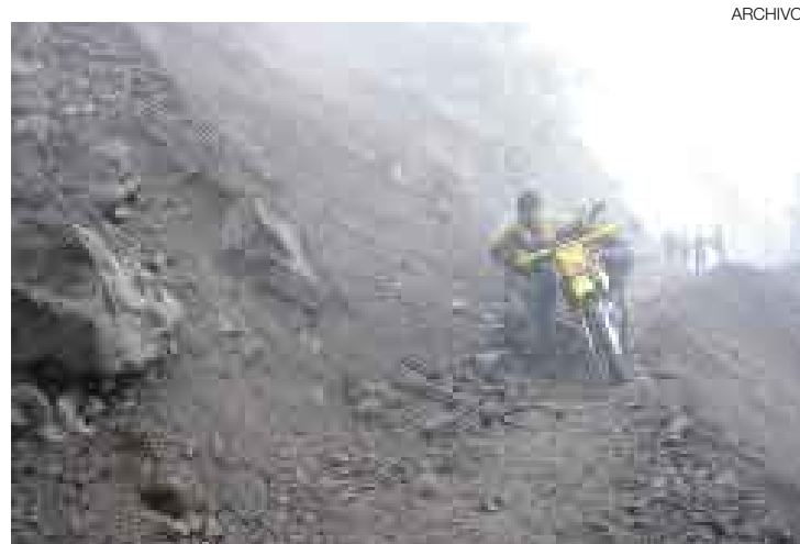
DAÑOS. El centro del país afronta por estos días los graves estragos que produce la temporada de lluvias. La población está alarmada.

■ Dos cuerpos aún no han sido hallados en la provincia de Tayacaja. Búsqueda continúa hoy