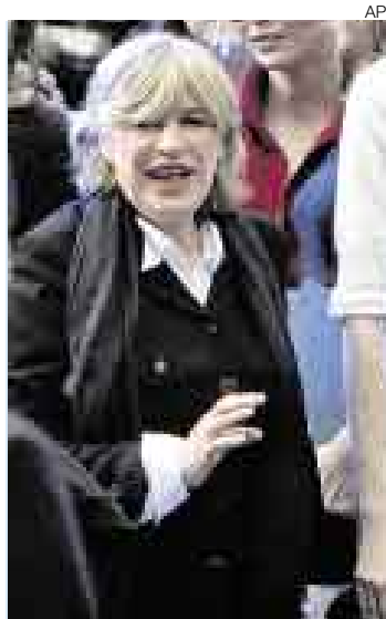
LEYENDA. Se hizo famosa en 1964 por el tema "As Tears Go By".

MADRID [EFE]. Está harta de los años 60 y harta de ser Marianne Faithfull, por eso rehúsa hablar de su pasado con The Rolling Stones y busca en su carrera como actriz papeles que se alejen de su imagen, aseguró la artista el viernes en Madrid, un día antes de actuar en la capital española.