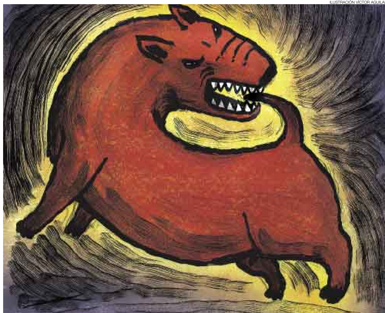
ILUSTRACIÓN VÍCTOR AGUILAR

yeron 62, con 44.000 conexiones domiciliarias, beneficiando a 220.000 habitantes.