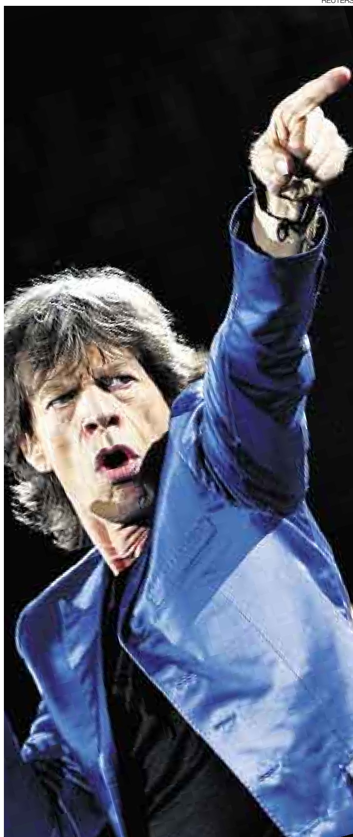
A SALVO. No se sabe si Mick Jagger estuvo al tanto del plan que tenían los Hell's Angels para eliminarlo.