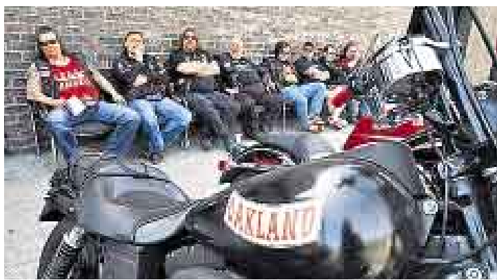
ÁNGELES DEL INFIERNO. Los demonios de la carretera estuvieron implicados en la muerte de un 'fan' en un concierto de los Stones.