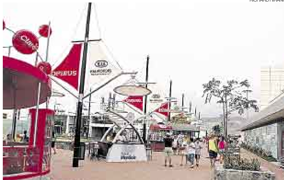
SIGUE CRECIENDO. PARA ESTE AÑO EL SPB ESPERA RECIBIR 1,8 MILLONES DE VISITAS.

Inversiones Castelar , empresa operadora del centro comercial Sur Plaza Boulevard (SPB), ubicado en el kilómetro 97 de la carretera Panamericana Sur en el balneario de Asia , evalúa el ingreso de un socio para seguir creciendo. “Siempre estamos abiertos a un posible aumento de capital para continuar con nuestro crecimiento”, señaló