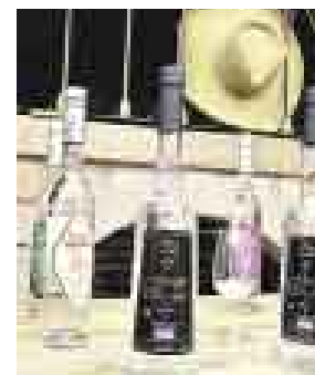
¿SE QUEDA? EL PISCO ES NUESTRA BEBIDA DE BANDERA.

Esta semana debería definirse si el Perú asiste como delegación oficial a la feria London Distil 2008 , una de las más importantes del orbe en el mercado de destilados. Si bien el sector privado ya se ha organizado a fin de presentar al pisco como una marca país, no ocurriría lo mismo con el sector público. Y es que hay cuatro ministerios que aún no confirman su aporte: Produce, Agricultura, Mincetur y Relaciones Exteriores . El presupuesto alcanza los US$90.000 y el sector público aportaría el 60% de esta suma.