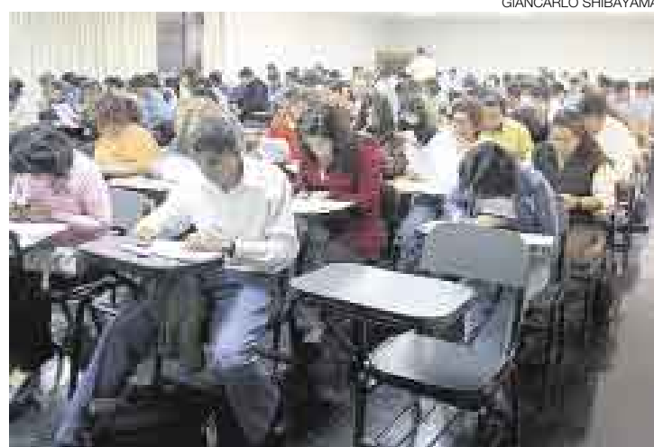
TODO LISTO. Este domingo 9 de marzo, los docentes rendirán la prueba eliminatoria para cubrir las vacantes que ofrece el Estado.

Por otro lado, la prueba para el nombramiento de 23.970 docentes se iniciará el 17 de marzo y la etapa de evaluaciones concluirá el 29 de abril, cuando se publique la lista de docentes nombrados. El examen se rendirá en 35 locales acondicionados en todo el país.