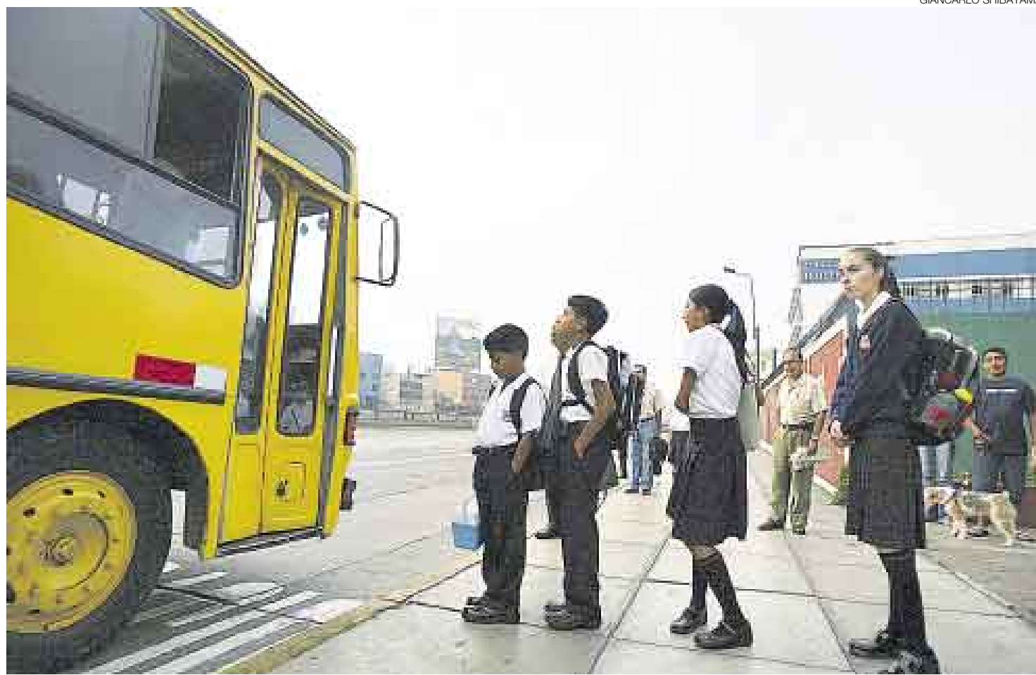
REGRESO A CLASES. A las 7:00 a.m. de ayer, la escena común en los paraderos de la ciudad era grupos de escolares a la espera del ómnibus.

Por su parte, el ministro de Educación, José Antonio Chang Escobedo, indicó que, debido a inconvenientes presentados para la contratación de docentes, en algunos colegios los alumnos serán atendidos por directores y auxiliares hasta que culmine el proceso de contratos y nombramientos.