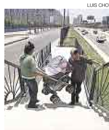
VÍA. El zanjón es parte del Cosac.

Hay cuatro postores para la concesión del servicio de pasajeros con buses troncales