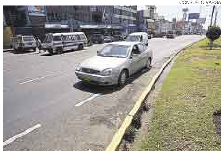
SAN MIGUEL. La primera fase de reparación de La Marina durará un mes, en el tramo comprendido entre las avenidas Faucett y Rafael Escardó.

A mediados de mes empezarán los trabajos de rehabilitación de las avenidas Javier Prado y Angamos.