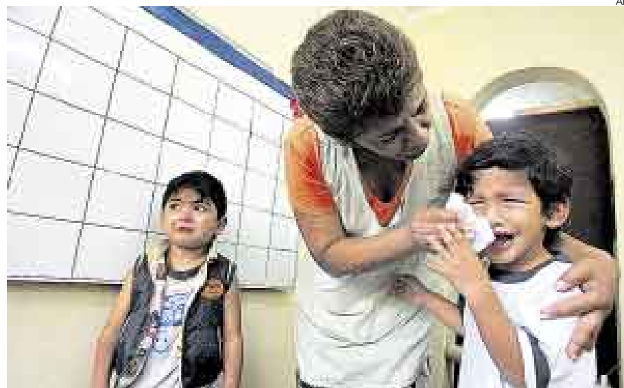
INCONTENIBLE. El nido Miraflores recibió a pequeños que por primera vez pisaban un aula.