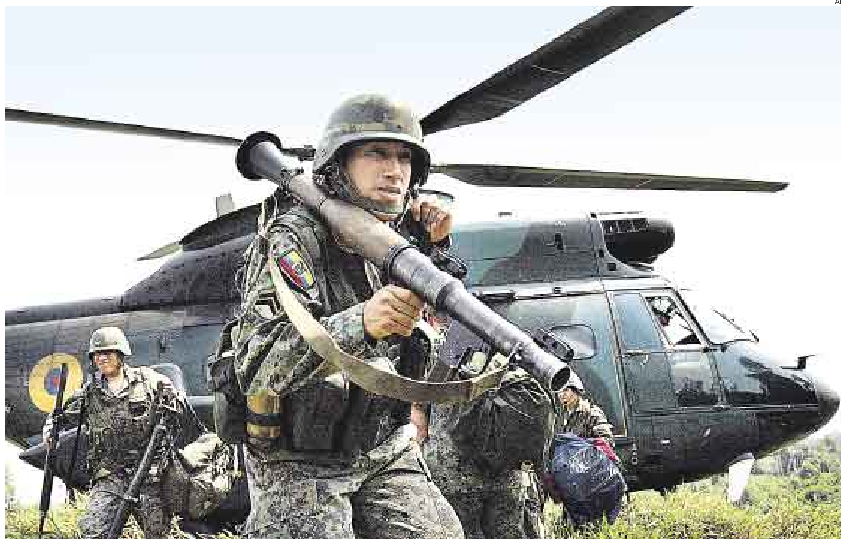
DESPLIEGUE. Soldados ecuatorianos desembarcan en la zona de Angostura cerca de Colombia. En tanto, Venezuela cerró el paso a los colombianos en San Antonio de Táchira.

Correa, que inicia hoy en Lima una gira por cinco países en busca de apoyo, aseguró anoche que el ataque colombiano al campamento de las FARC frustró la liberación en Ecuador de 12 rehenes, entre ellos Ingrid Betancourt. El jefe de la policía colombiana, Óscar Naranjo, dijo que se había hallado en las computadoras incautadas a 'Raúl Reyes' mensajes que revelarían vínculos comprometedores entre las FARC y el chavismo. Editoriales de los principales diarios de Colombia, Ecuador y Venezuela. [A2,3,5]