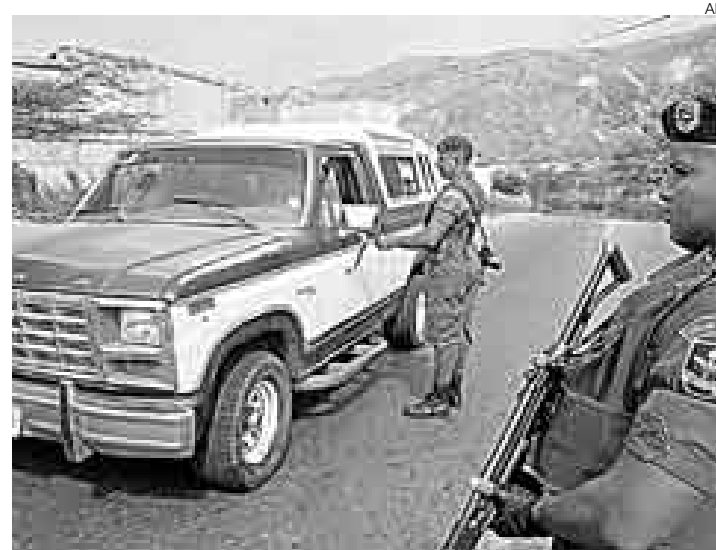
PASO CERRADO. En San Antonio de Táchira, soldados venezolanos recibieron la orden de no dejar pasar a ciudadanos y vehículos colombianos.