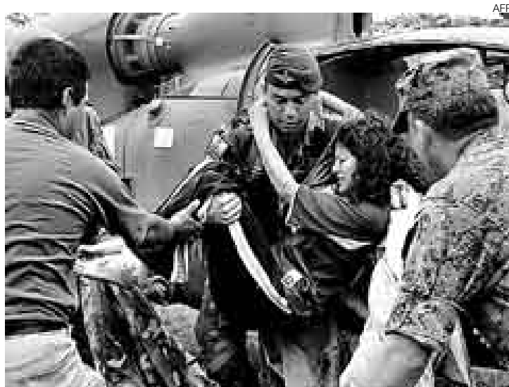
RESCATE. Soldados ecuatorianos evacuaron a esta joven y otras dos mujeres que sobrevivieron al ataque contra el campamento de las FARC.