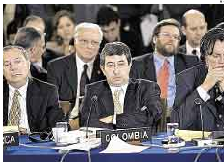
POSICIÓN. “Esto no es un tribunal, es un foro de facilitación”, dijo Ospina.

Al cierre de esta edición, los 34 embajadores de la OEA tampoco se ponían de acuerdo sobre la necesidad de formar una comisión