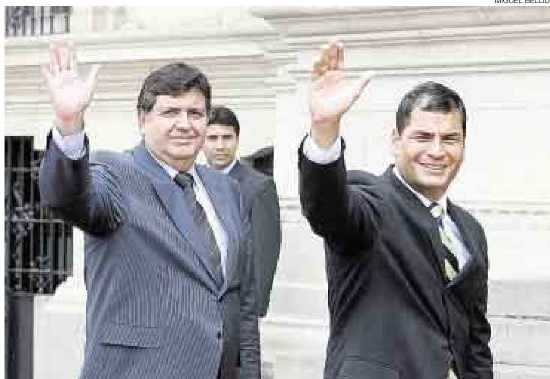
BIENVENIDO. Alan García le recaló a Rafael Correa que el Perú tiene “un idilio en marcha con el Ecuador”.

“En este caso se ha ido más allá de lo que las leyes internacionales permiten. Eso no podemos silen-