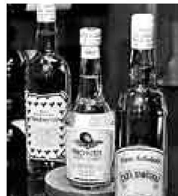
A INGLATERRA. El pisco habría confirmado su presencia.