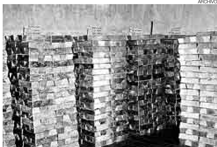
DORADO. En las siguientes jornadas el precio del oro podría superar los mil dólares por onza en los mercados internacionales.

OPEP acusa a EE.UU. de aumento del crudo por mala gestión económica