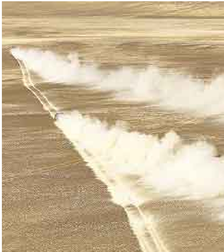
TODOS TERRENO. Los pilotos se enfrentan a las difíciles rutas del desierto.