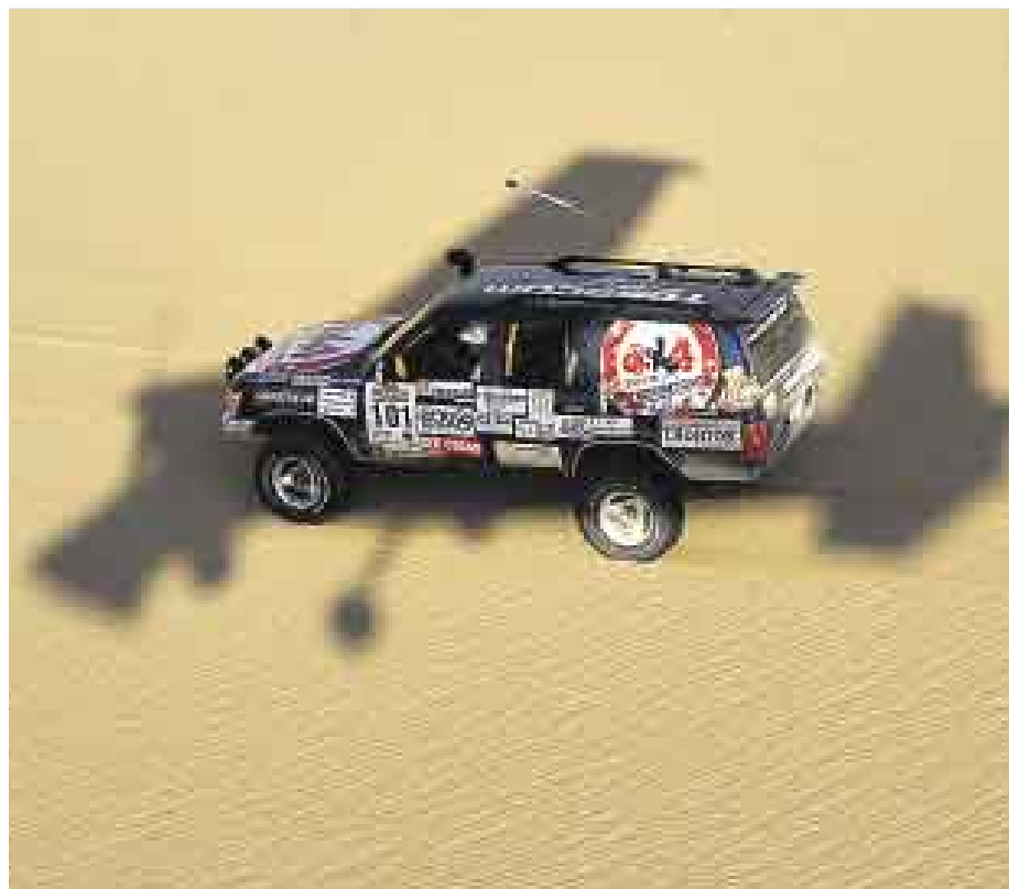
DURA PRUEBA. Los carros deben estar preparados para soportar temperaturas infernales.