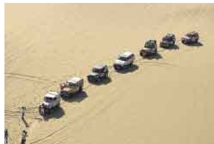
FILA INDIA. Son 21 los equipos que participan de esta edición.

Los 21 equipos están formados por tres miembros. Un piloto, un copiloto y un tripulante, quien asume funciones de mecánico por lo general. Hay veinte equipos peruanos (entre ellos dos de Ica, uno de Chinchay y uno de Arequipa) y uno chileno, el equipo del Chile Dakar que llega por segundo año consecutivo a Ica y que le confirmó a Deporte Total su participación en el Rally Dakar, que se realizará el próximo año en