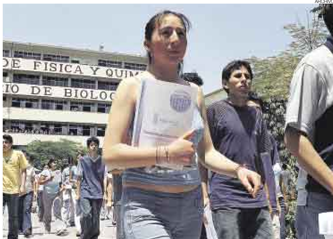
TODO POR UNA DEUDA. La Universidad Villarreal interpuso un recurso ante el Tribunal Constitucional para no pagar una deuda por arbitrios, pero la sentencia le fue adversa. El fallo fue claro: las universidades deben pagar esa tasa.

Sin embargo, tras ser apelada esa resolución, en el 2006, la Cuarta Sala Civil declaró infundada la demanda, pues la Consti-