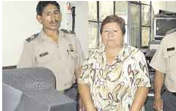
DENUNCIA. Tras ser dada de alta, la directora acudió a sentar la denuncia.