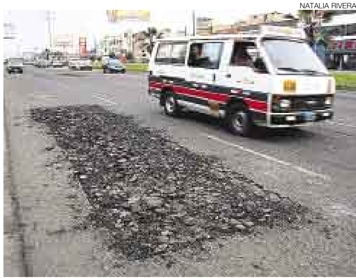
BACHES Y COMBIS. Lector celebra que se restaure la avenida La Marina pero pide regular su tránsito (ver: Caos en La Marina).