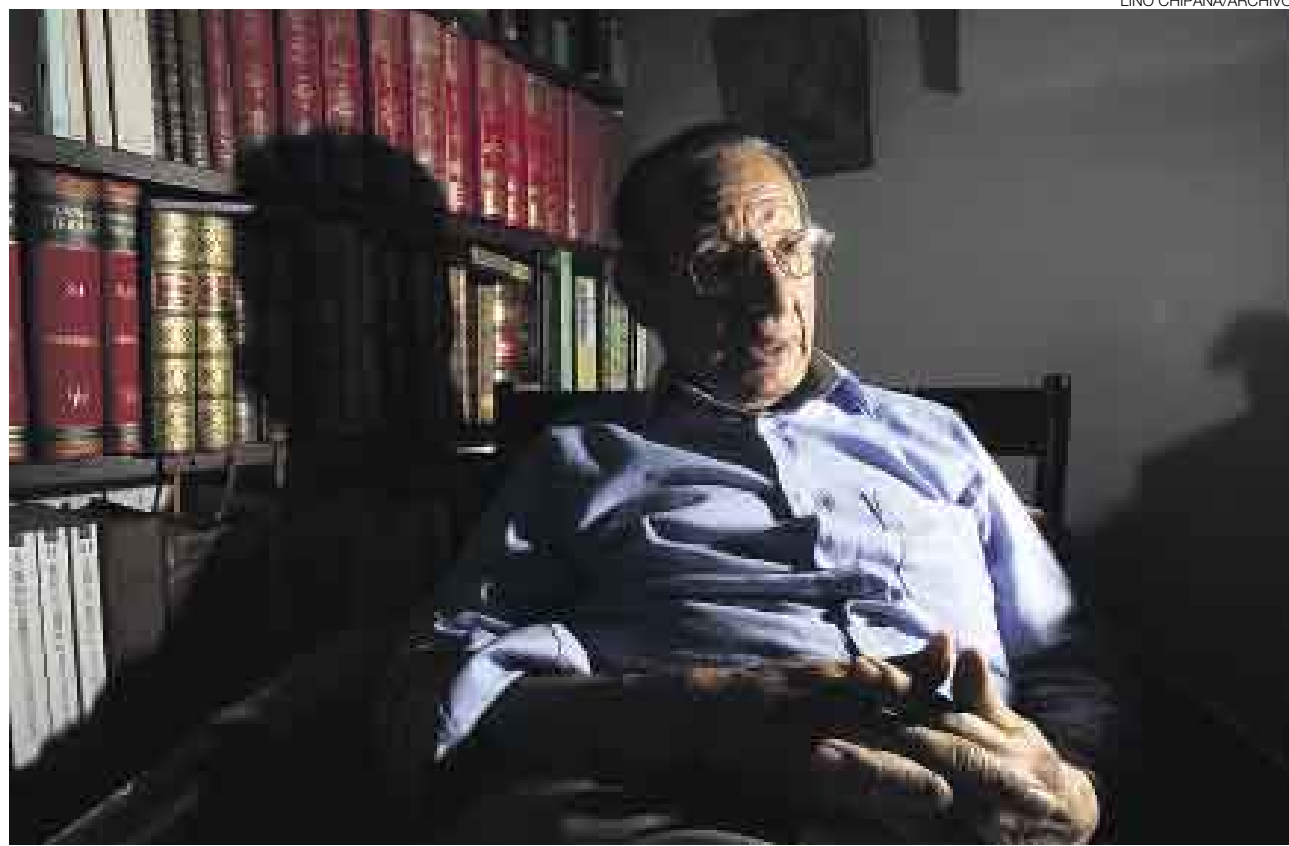
EXPIACIÓN. Tras conocer la terrible experiencia de la viudez, Carlos Eduardo Zavaleta nos entrega una novela notable y conmovedora.