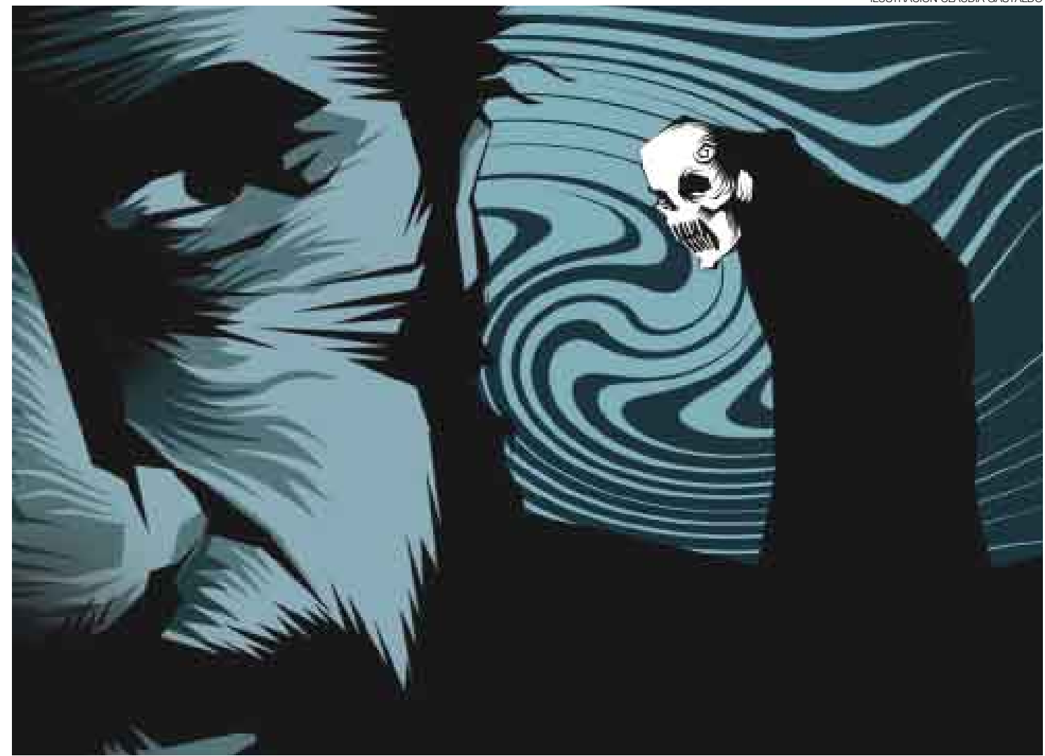
ILUSTRACIÓN CLAUDIA GASTALDO

La visita de Ahmadineyad sella la influencia decisiva de Teherán sobre las diversas milicias iraquíes que, al pasar a la ofensiva contra los suníes y Al Qaeda en el 2006, desencadenaron prácticamente una guerra civil. Las tribus y facciones suníes, excluidas del futuro político y económico iraquí, desposeídas de las rentas del petróleo —confiscadas por chiitas y kurdos en virtud de la nueva constitución—, instrumentalizaron al jefe de Al Qaeda en Mesopotamia, el jeque