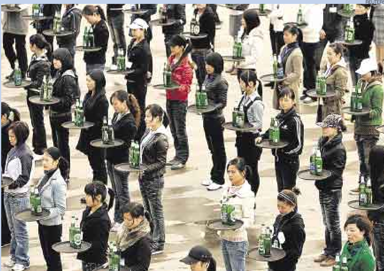
▲ PARA MEJORAR EL SERVICIO. En un año especial debido a las próximas Olimpiadas de Beijing, la sociedad china ha experimentado diversos cambios, algunos relacionados con Occidente. Así, cientos de personas participaron de un entrenamiento para convertirse en mozos en karaoke. La capacitación se dio en un estado en la provincia de Zhejiang.