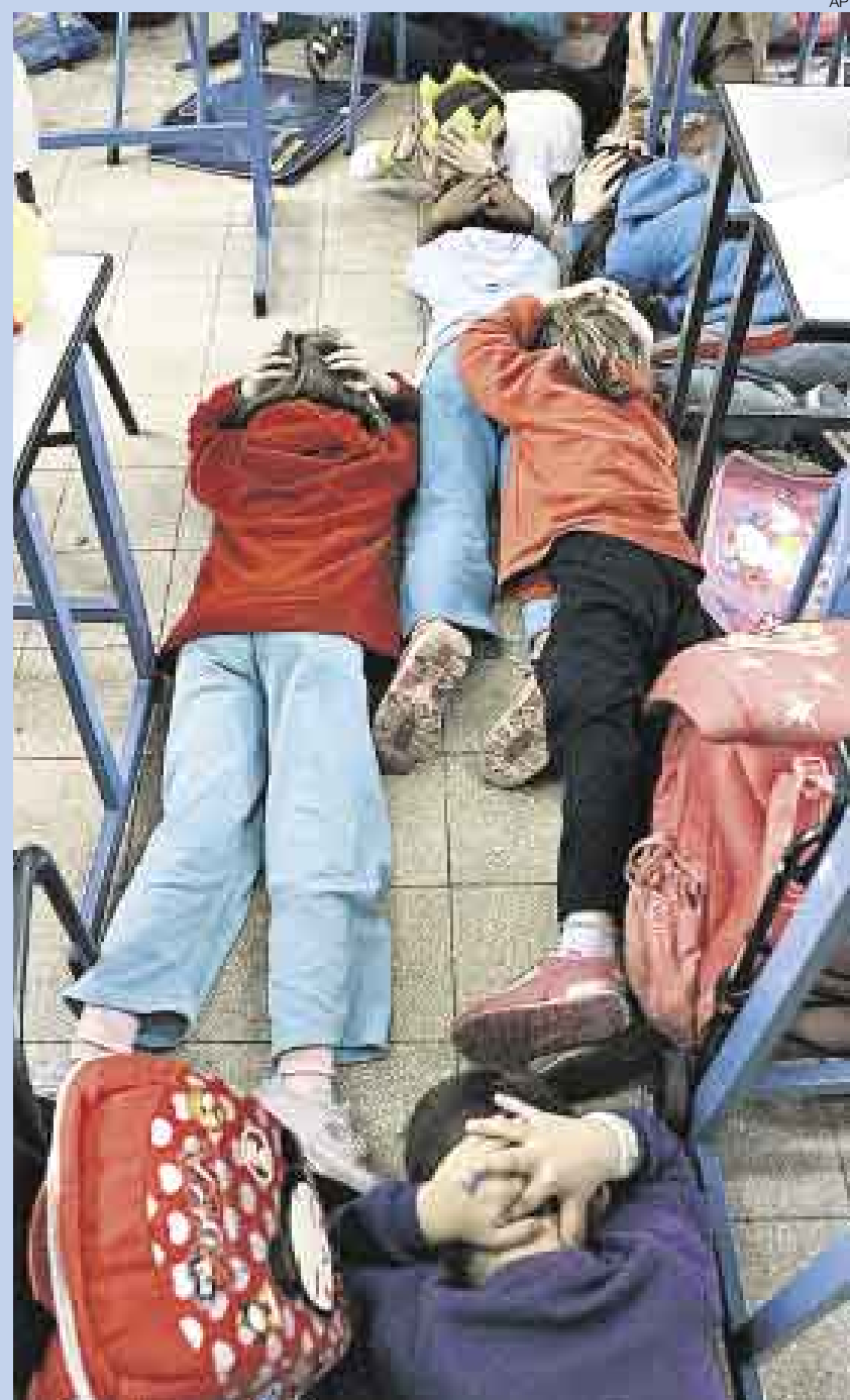
▲ UNA LECCIÓN QUE PUEDE SALVARLOS. Debido a los constantes ataques de cohetes lanzados por integrantes de Hamas, los niños israelíes de Ashkelon, una ciudad cercana a la frontera con la franja de Gaza, reciben instrucción sobre cómo protegerse ante casos de emergencia.