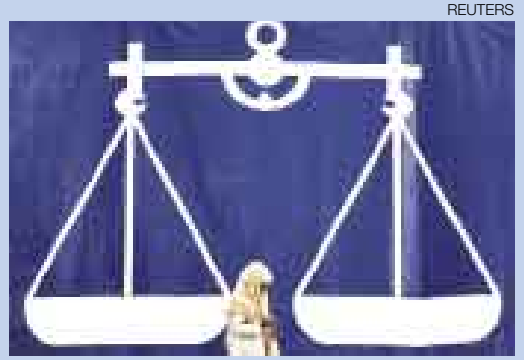
▲ CUESTIÓN DE SÍMBOLOS. El ambiente electoral está en su apogeo en Malasia. Esta mujer camina junto a la balanza que representa al opositor Frente Nacional, favorita según las encuestas.