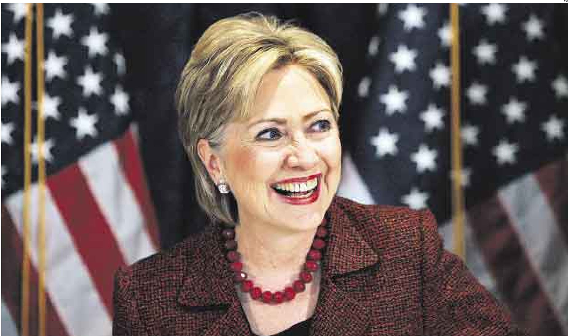
NO SE RINDE. Los recientes triunfos de Hillary Clinton en Texas, Ohio y Rhode Island le han dado el oxígeno necesario para continuar en la contienda contra Barack Obama.

Pese a las últimas victorias de la ex primera dama, los números no la favorecen todavía. Hay pelea para rato