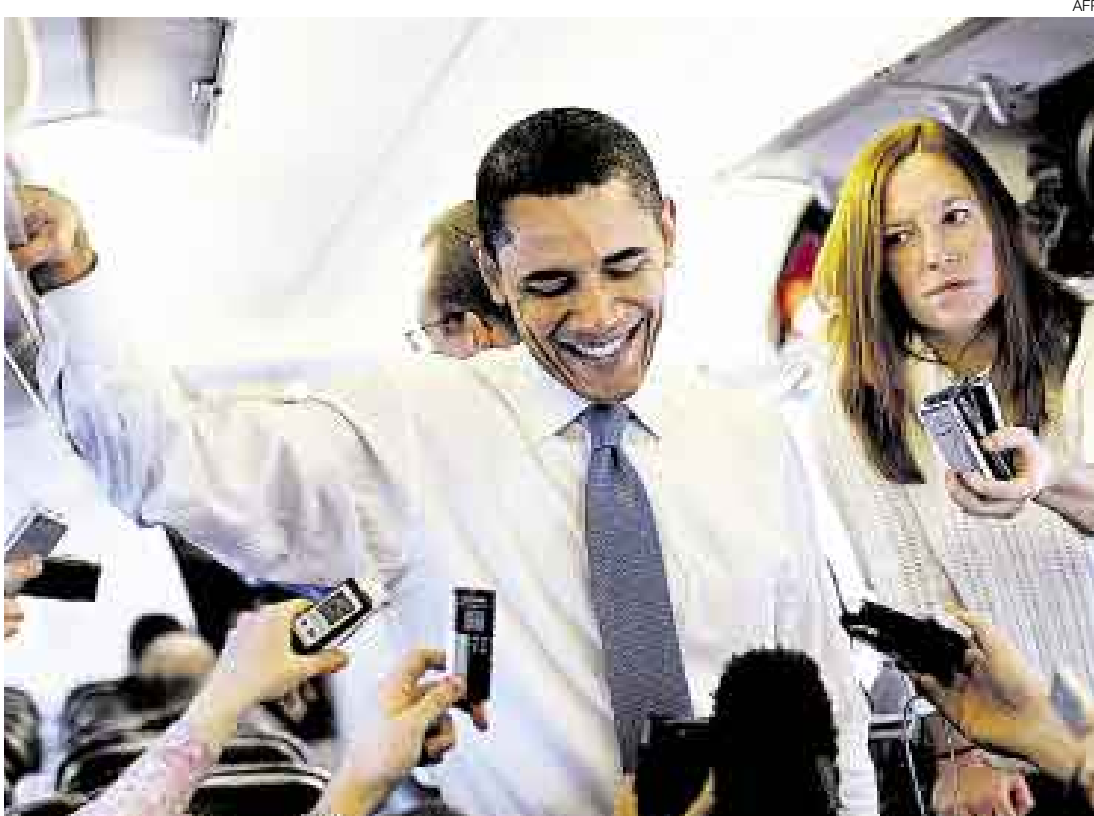
EL CARISMÁTICO. Barack Obama tiene cierto atractivo entre algunos republicanos e independientes. Le haría la pelea a McCain, quien no es bien visto por los sectores más conservadores del Partido Republicano.

El reto vendría en Texas y Ohio. El primero es el estado más grande del país y donde se concentra gran cantidad de votantes hispanos, un electorado regularmente favorable a los Clinton. El segundo es un estado industrial, deprimido económicamente y afectado, según sus trabajadores,