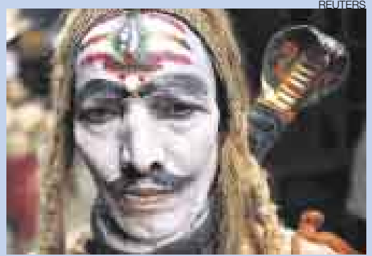
▲ CARNIVAL INDIO. Hombres y mujeres devotos del dios Shiva se disfrazaron durante una festividad en la zona de Trakeshavar, al este de la India. Cientos de matrimonios buscaron la bendición en esta tradicional fiesta india.