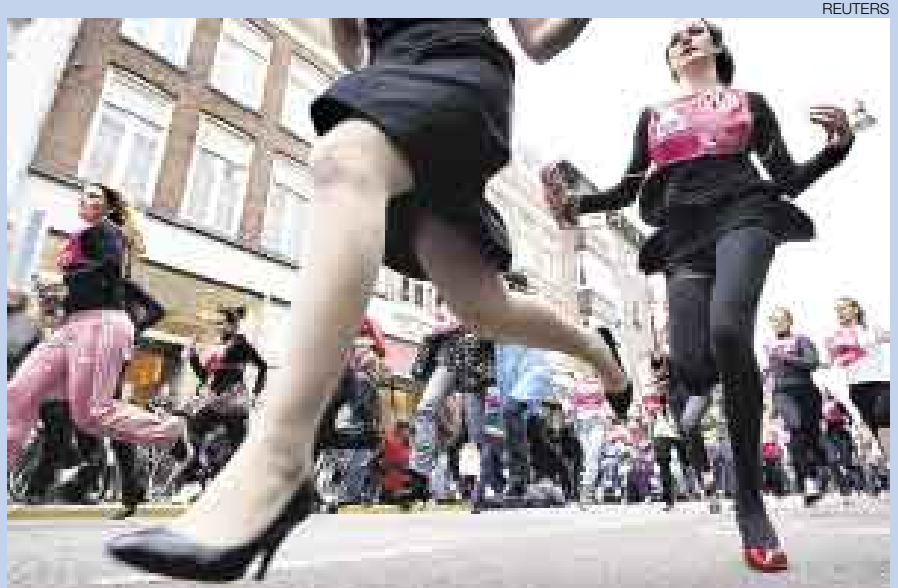
▲ AL ESTILO HOLANDÉS. Aproximadamente 125 mujeres participaron de una tradicional carrera por el centro de Ámsterdam, ataviadas con vestimentas de distintas épocas y con zapatos de tacos altos. La ganadora se llevó un premio de 10 mil euros.