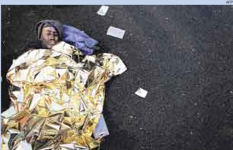
▲ EN BUSCA DE UN FUTURO MEJOR. Cientos de africanos siguen llegando en balsas hasta localidades como el puerto Los Cristianos, en Santa Cruz de Tenerife, España. No obstante, muchos quedan en el intento y hasta pierden la vida.