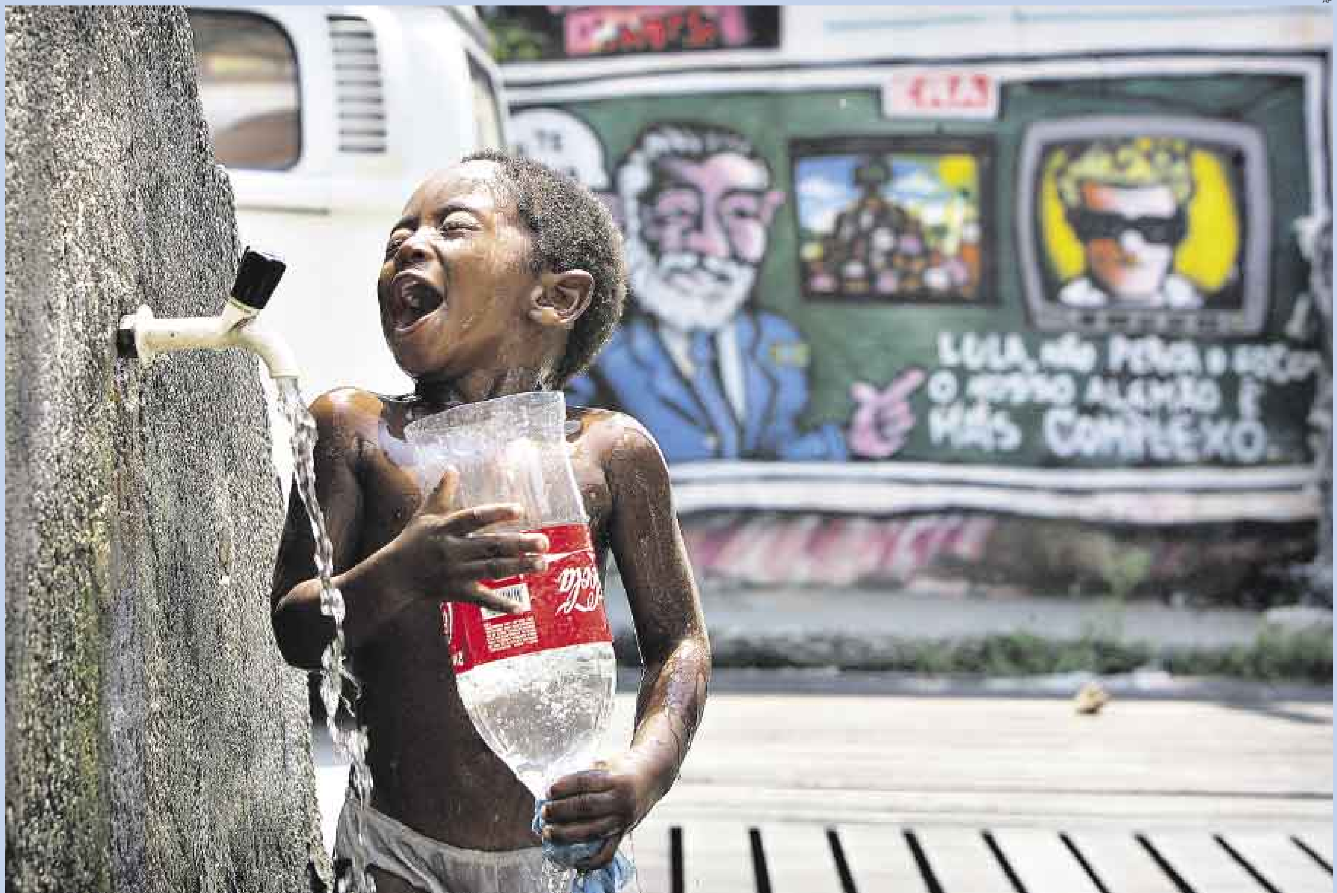
▲ NECESARIO CHAPUZÓN. El fuerte verano que sacude el hemisferio sur motiva que niños y adultos aprovechen cualquier lugar para beber agua o refrescarse, tal como lo hace este menor en una favela de Río de Janeiro. En Brasil, el gobierno de Lula da Silva ha lanzado un programa de ayuda a los menores que son víctimas de la pobreza y de las mafias de narcotraficantes en Brasil.

CONTRADICCIONES DEL SER HUMANO. Lejos del ruido político que fue el común denominador en América Latina durante la última semana, los diversos matices de la vida ofrecieron estas imágenes en distintos continentes. El caluroso verano en Río de Janeiro, el miedo cotidiano en el sur de Israel, una carrera solo para mujeres en Holanda o una fiesta tipo carnaval a la usanza hindú.