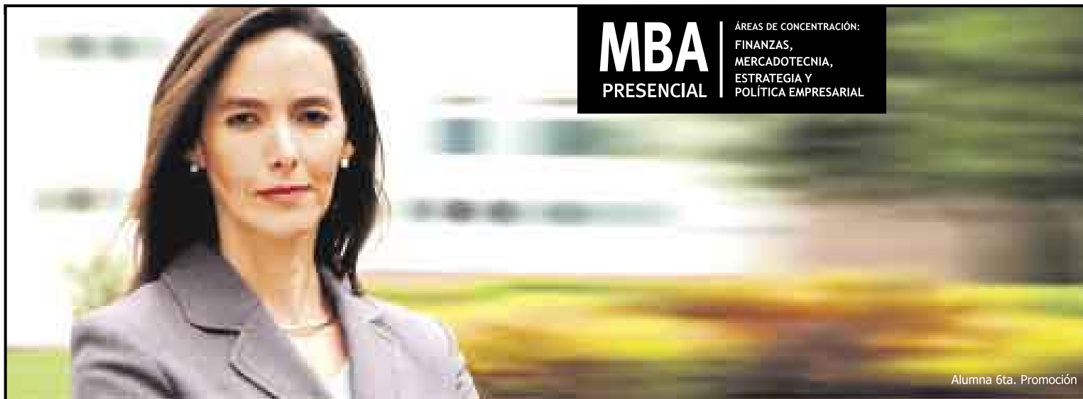
Alumna 6ta. Promoción

REALIDAD. Según los ex estudiantes encuestados por el diario "Financial Times" para su ranking de las 100 mejores MBA del mundo, el salario de los que estudiaron en 67 de las instituciones se incrementó en más del 100%. En el caso de otras 24 universidades y escuelas, los graduados afirmaron que su mejora salarial fue de más del 90%. El ranking, sin embargo, no señala en cuánto tiempo se consigue esta mejora. En términos generales, el MBA debe estudiarse pensando que uno duplicará su sueldo en el mediano plazo y no inmediatamente después de terminar los estudios.