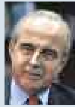
ISMAEL BENAVIDES, MINISTRO DE AGRICULTURA.

● El ministerio ha planteado una nueva política para las compensaciones agrarias por el TLC, que estará centrada en capacitación. La reacción de los gremios hace notar que faltó comunicación con ellos.