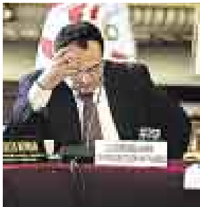
¿TERCO? LOS EMPRESARIOS LE EXIGEN QUE JUSTIFIQUE POSICIÓN.

Mañana se reunirán los representantes de los gremios empresariales que integran la Confiep para evaluar qué posición tendrán ante la negativa del Gobierno de adoptar medidas que frenen o amortigüen la caída del tipo de cambio . Lo más probable es que se apruebe exigir a estas medidas concretas, así como pedirle al MEF que no solo se niegue a las propuestas empresariales, sino que justifique sus decisiones con datos concretos. Esto en alusión a la negativa de permitir que se pague impuestos en dólares.