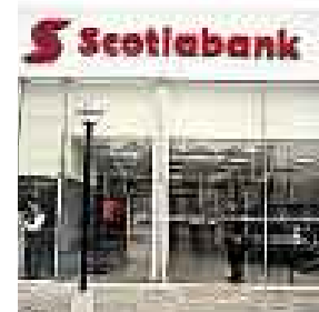
¿Y AHORA? ES POSIBLE QUE BUSQUE OTRAS OPCIONES.

Ahora que la operación de compra del Banco del Trabajo por parte del Scotiabank se cayó (dijeron “paso” cuando Cencosud compró Wong y ahora la cartera del Bantra “no es lo mismo”), es muy probable que el banco canadiense vuelva a buscar cajas rurales para acceder al sector de las microempresas de manera sólida y no patinar en el intento. Después de todo, el estudio para ingresar a este segmento de las finanzas ya fue realizado por encargo de ellos mismos por socios de la consultora Certicom .