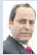
ALFONSO MIRANDA, VICEMINISTRO DE PESCA.

● Un paso importante para la integración en las comunicaciones de peruanos no hispanohablantes dio Movistar con el lanzamiento de su servicio de atención telefónica en quechua y aimara. Buena iniciativa.