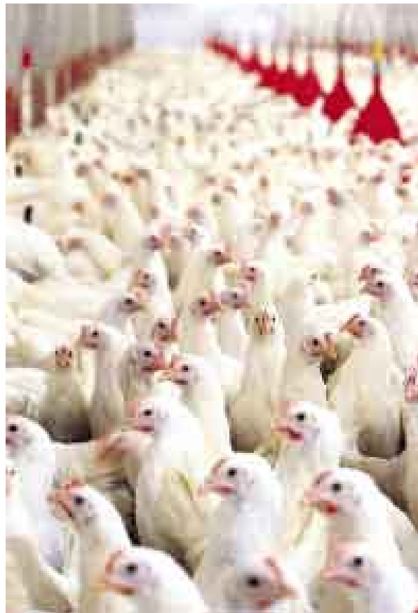
ENROLLO. CON UN CÁLCULO INDEPENDIENTE DEL PBI AVÍCOLA, EL MINISTERIO DE AGRICULTURA ESPERA SUPERAR EL PROBLEMA.