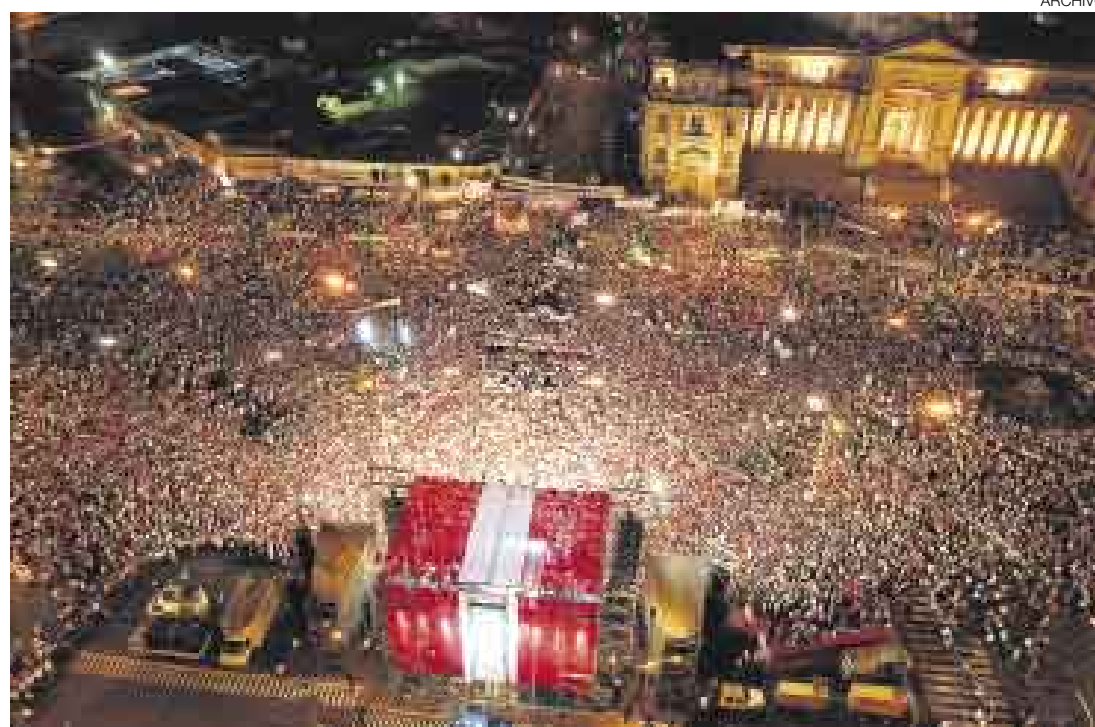
LOS MILLONES DE LA POLÍTICA. Solo 18 agrupaciones presentaron su información financiera del 2006, tal como lo ordena la Ley de Partidos Políticos. Ellas reportaron gastos de campañas superiores a S/.24 millones.