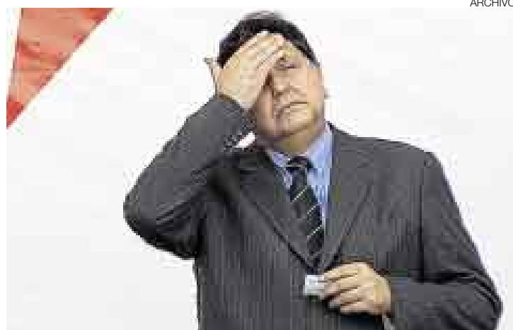
¿Y AHORA QUÉ HAGO? La popularidad del presidente García no remonta.

“El Gobierno no vive jalado de las narices por las encuestas. Las evaluamos, respetamos y atendemos, por supuesto que sí, pero