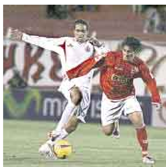
ESPERANZA. Con el triunfo de ayer, Cienciano sumó seis puntos y mantiene posibilidades de clasificar.