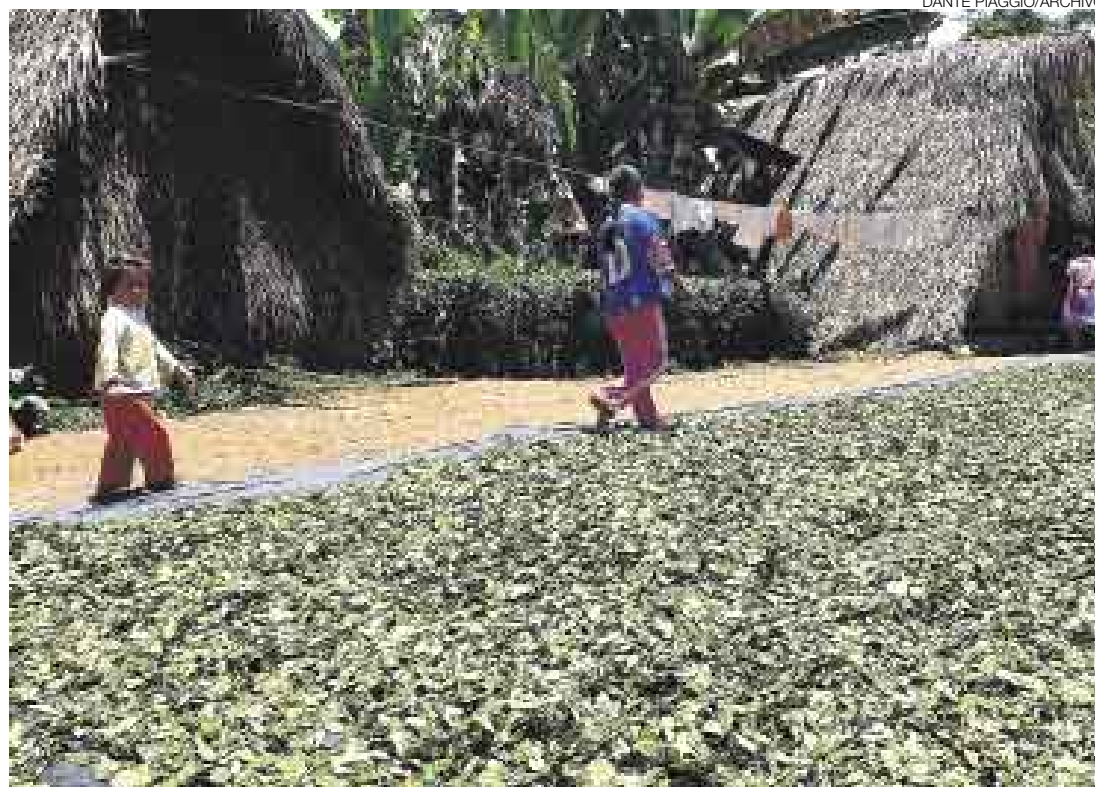
EN MEDIO DE LA DISCORDIA. El cultivo de la hoja de coca vuelve a causar fricción entre el Ejecutivo y una región.

Al respecto, el primer ministro Jorge del Castillo informó a El Comercio que el Ministerio de