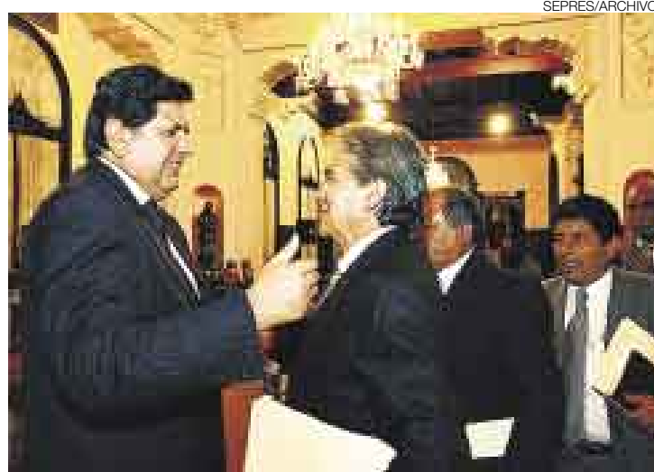
¿ENEMIGOS ÍNTIMOS? Desde que se inició el proceso de descentralización, la relación entre el Ejecutivo y los presidentes regionales ha tenido altibajos.

Esto en caso de que atenten contra la unidad y soberanía del Estado, desconozcan a las autoridades nacionales o desacaten la normatividad nacional, y que esto