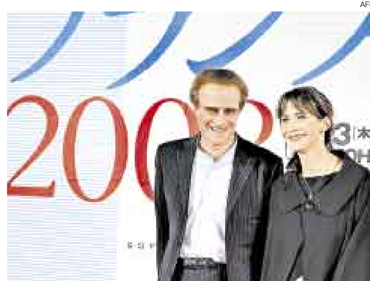
ACTORES. Christopher Lambert y Sophie Marceau en Tokio.

Esta es la tercera vez consecutiva que este festival se lleva a cabo en las ciudades de Tokio y Osaka, un encuentro que es organizado por Unifrance y la Embajada de Francia en Japón, y que en esta oportunidad cuenta con la presidencia de Sophie Marceau. AFP