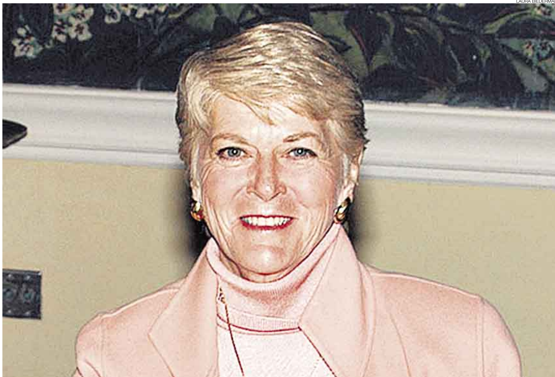
SE FUE. Geraldine Ferraro formaba parte del equipo económico de Clinton, pero salió de la campaña por la puerta falsa por sus polémicos comentarios. En 1984 fue candidata a la vicepresidencia.