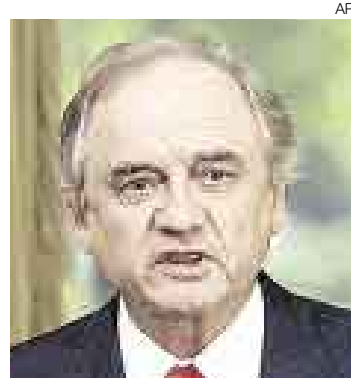
QUEJA. Para el canciller Foxley, solo se busca heredar un problema.

SANTIAGO DE CHILE. “¿Es eso lo que queremos? ¿De verdad queremos que los niños, que las próximas generaciones, hereden un problema que viene desde nuestros tatarabuelos?”. Esa fue la queja del canciller chileno,