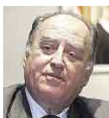
JUSTIFICACIÓN. El ministro Flores-Aráoz defiende derecho a informar.

Alejandro Foxley, al comentar la disposición del Gobierno Peruano de imprimir textos escolares en los que se explicará la posición del Perú en la demanda marítima presentada ante la Corte Internacional de La Haya.