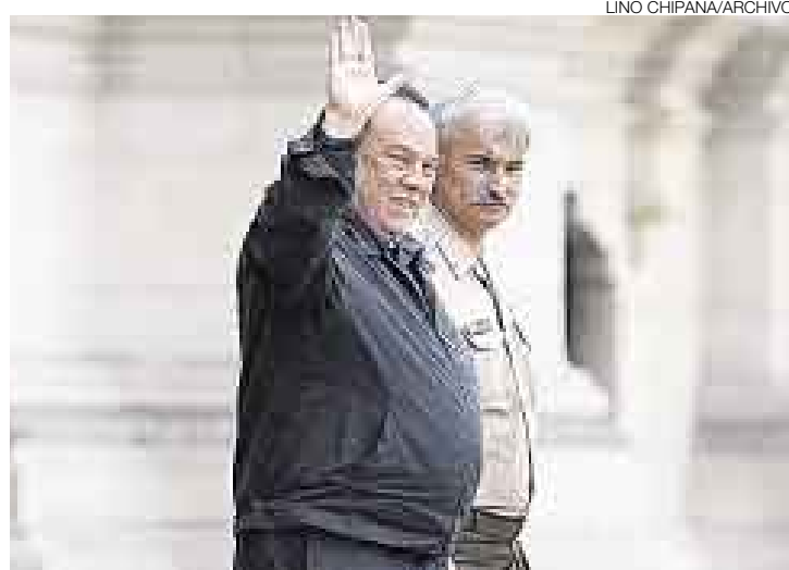
SIGUE. No fue necesario el voto de Alva Castro para rechazar la censura.

Ambos grupos de oposición únicamente acumularon 32 de los 61 votos necesarios para la