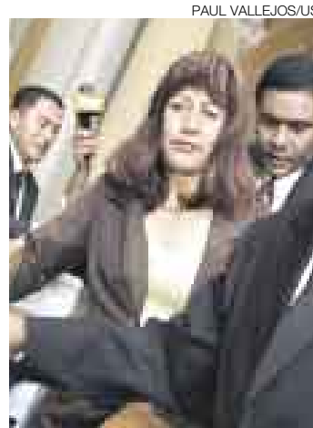
BENITES. Se retiró a trompicones.

Aunque finalmente el Congreso dio marcha atrás, lo sucedido el miércoles en el hemiciclo entre gallos y medianoche no fue una 'otorongada' más. Fue un acto corrupto.