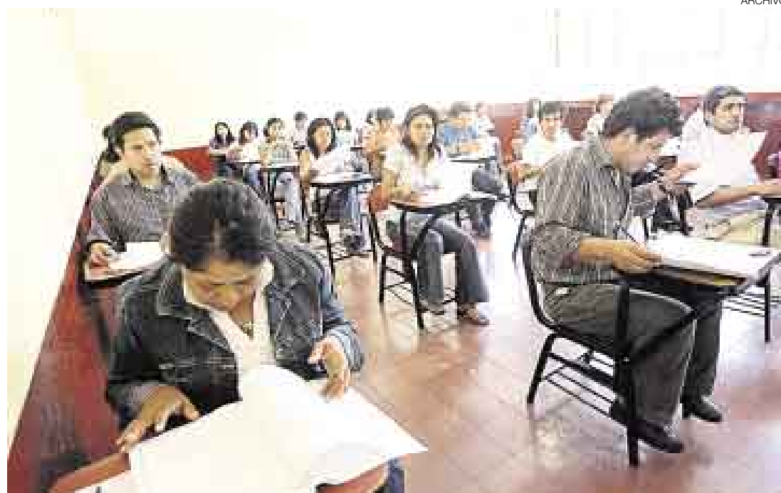
A MEJORAR ESCUELA DE MAESTROS. El Ministerio de Educación invocó a las facultades y escuelas de educación a mejorar su formación académica a fin de lograr un mejor perfil profesional de los maestros.

“Los resultados demuestran que la inmensa mayoría del profesorado nacional no está en el nivel superlativo de calidad que se necesita para la educación pública”, refirió Chang.