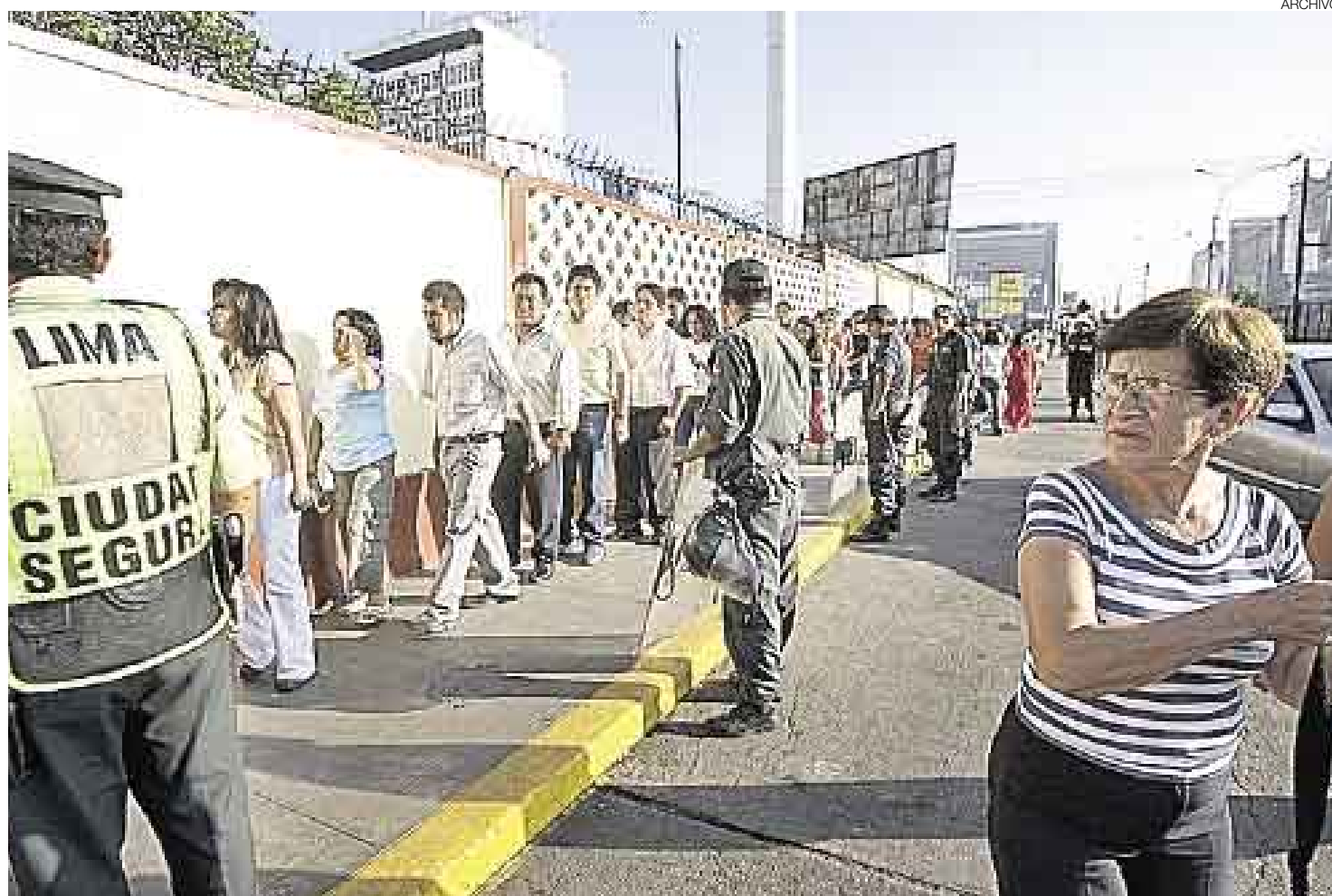
FRUSTRACIÓN NACIONAL. Más del 95% de los profesores salió con nota desaprobatoria. Muchos de ellos enseñaban desde hace varios años en diversos colegios de todo el país como contratados. En la imagen se ve la fila de maestros que se formó el día que rindieron la prueba.

El ministro calificó los resultados de la prueba nacional como alentadores, porque se había supera-