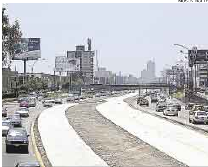
OBRAS EN ESPERA. El nuevo comité de licitación deberá darse prisa para que el corredor vial no se quede sin ser usado por mucho tiempo.

El Comité Especial de Licitación tenía la responsabilidad de detectar dichos vicios en la etapa de precalificación, pero no lo hizo. La razón de estas omisiones