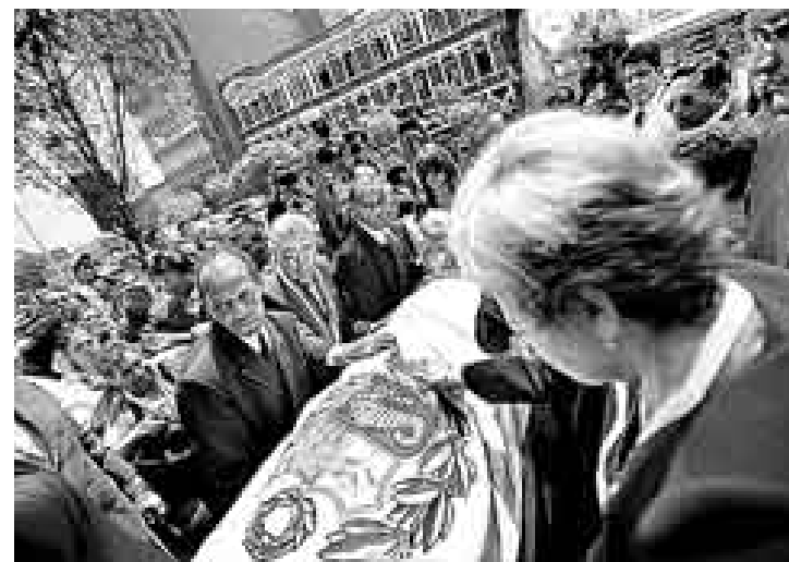
PESAR. Al llegar a la fiscalía, el féretro fue cubierto con una bandera.

A despecho de esto, lo que más han destacado sus colegas y amigos ha sido su entereza, entrega y lucha por la autonomía del Ministerio Público.