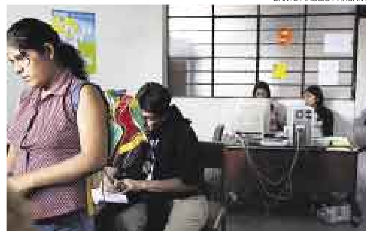
LOS HIJOS EN MEDIO. Los padres acuden a las Demunas para exigir que sus ex parejas les den más tiempo con los hijos.

36% era de sexo masculino. Un porcentaje mayor a los casos que llegan a ser denunciados y que aun así no reflejaría las dimensiones reales del problema, debido al sentimiento de vergüenza que experimentan los afectados con solo tener menor fuerza física, la mujer apela a golpes con objetos contundentes e incluso cortes con arma blanca, pero el maltrato psico-