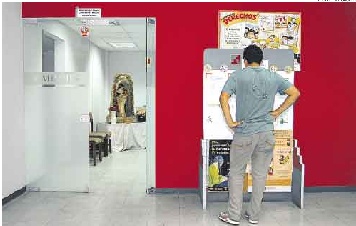
CENTRO DE EMERGENCIA MUJER. Su propio nombre ya inhibe a los hombres a acercarse a denunciar algún caso de violencia familiar.