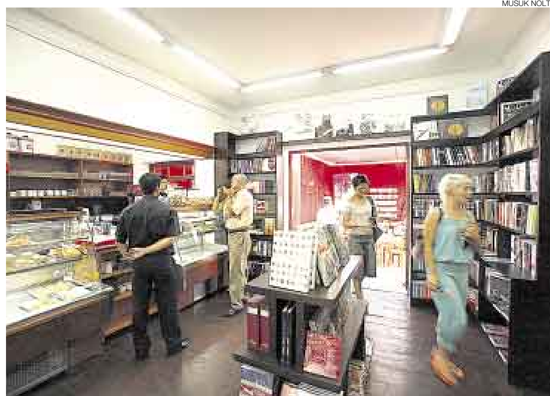
PIQUEO LECTOR. En su alianza con La Baguette, este nuevo concepto de librería sorprenderá al lector limeño.

"Con Ksa Tomada buscamos generar una oferta distinta a lo que hay en el mercado. Creemos que el negocio de las librerías ha llega-