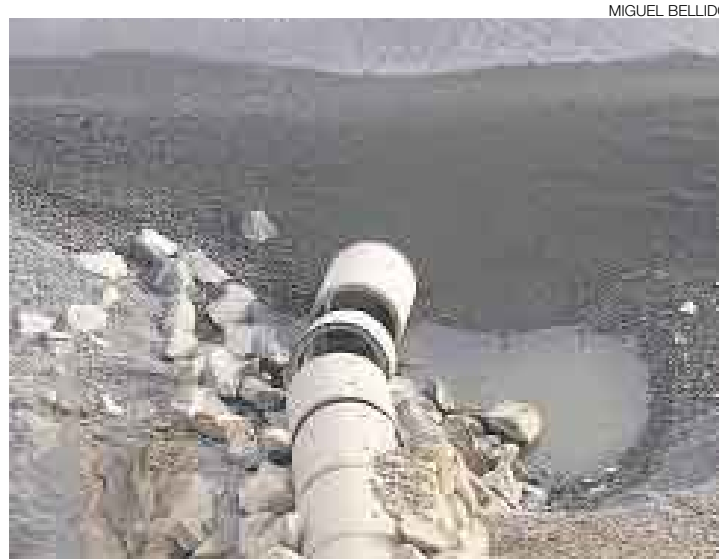
EN ESPERA. El cierre del 80% del colector Costanero impide iniciar los trabajos de estabilización del talud, aseguró el alcalde de San Miguel.

■ El colector Costanero arroja al mar 3,7 metros cúbicos por segundo de aguas residuales.