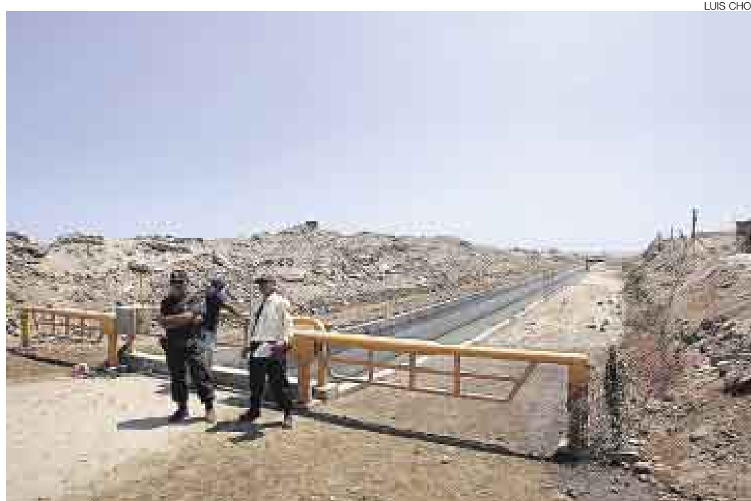
DESAGÜE AL MAR CHALACO. El Interceptor Norte, habilitado por Sedapal, descarga 3 metros cúbicos por segundo de aguas servidas en el mar chalaco. Los vecinos de la zona de Taboada se quejan por esta medida.