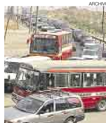
OBRA. La prolongación de la autopista Prialé sigue pendiente.

■ Provias Nacional licitará en abril vía de evitamiento para aliviar la Carretera Central