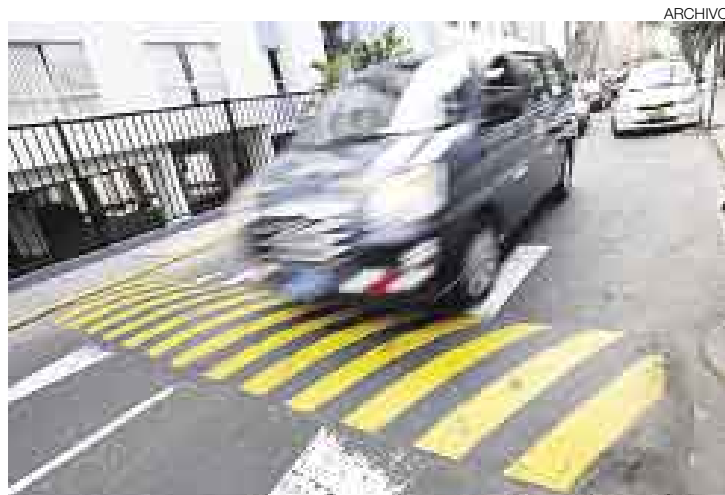
NOCIVO. Rompemuelles inapropiados causan daño a los vehículos.