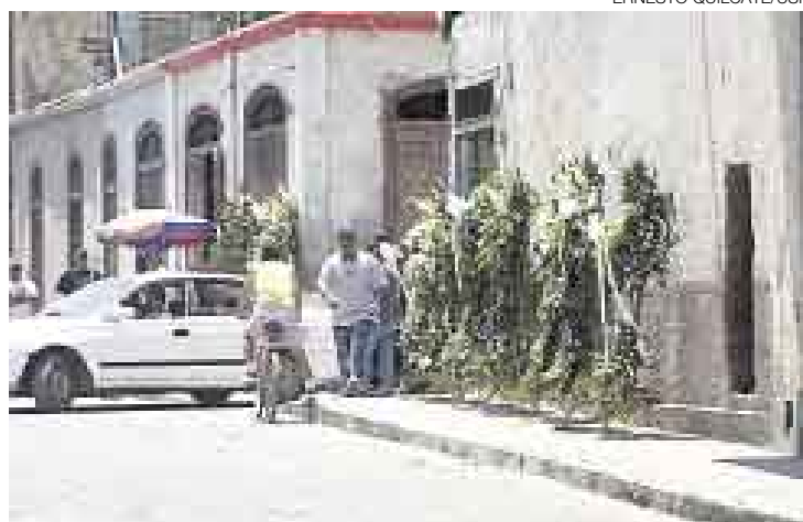
MÁS VIOLENCIA. En el velorio de la pareja sus amigos juraron vengar sus muertes. Durante el entierro dispararon al aire.

■ Ayer fueron enterrados cuerpos y amigos juraron vengar muertes