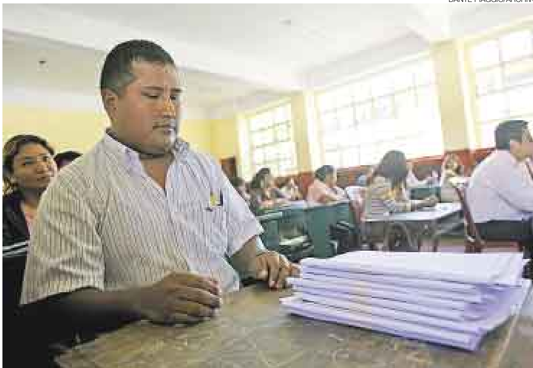
OPCIÓN. Los docentes que aprobaron con menos de 14 serán contratados y podrán tentar el nombramiento.

El titular del sector, José Antonio Chang, declaró por la mañana que su cartera mantendrá alta la valla (de una nota mínima de 14) para el nombramiento docente por respeto a los 151 maestros que se mantienen en carrera en el Concurso Público