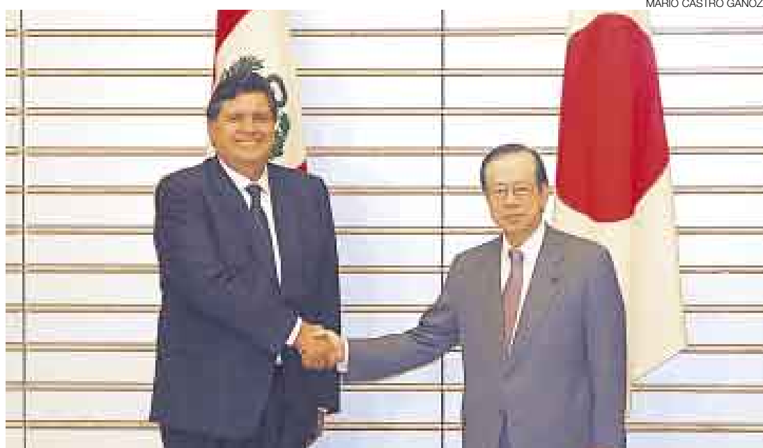
CON EL JEFE DEL GOBIERNO. El primer ministro japonés, Yasuo Fukuda, pidió un juicio justo para Fujimori.

“Nosotros los peruanos tenemos enorme confianza en el Japón.