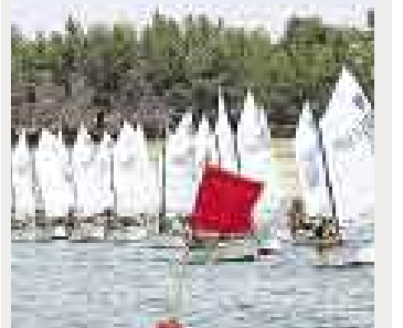
A LA MAR. El equipo nacional destaca en el Sudamericano.