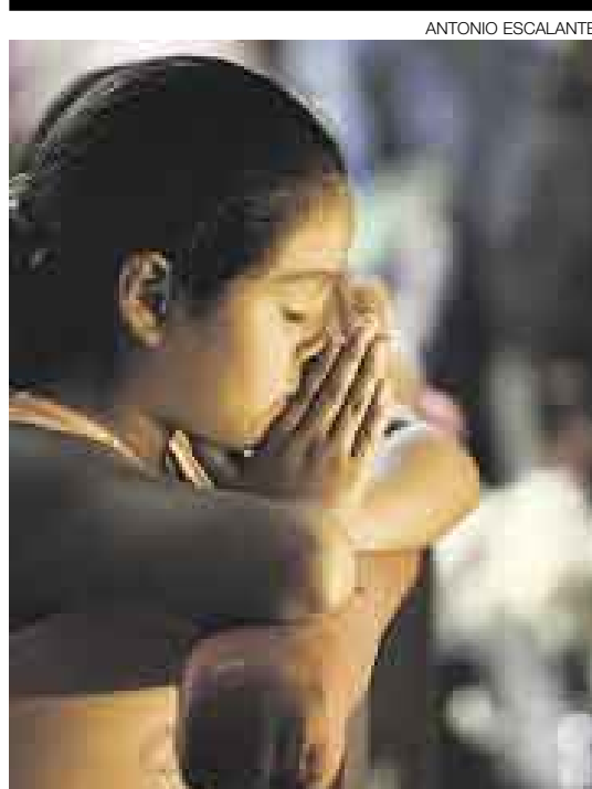
REFLEXIÓN. La tradición de recorrer siete iglesias en Jueves Santo comenzó en Roma durante la Edad Media.

Una razón de peso es que, según la Organización Mundial de la Salud, cerca de 177 millones de niños están amenazados en todo el mundo por este problema y se prevé que para el año 2015 haya 2.300 millones de personas mayores de 15 años con problemas de sobrepeso. [A11]